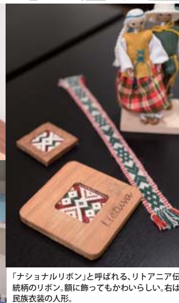
「ナショナルリボン」と呼ばれる、リトアニア伝統柄のリボン。額に飾ってもかわいらしい。右は民族衣装の人形。