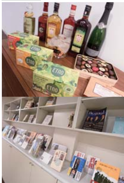
ハーブティー、ハチミツ、チョコレート、35度あるハーブ入りのリキュール類等、今後輸出に力を入れていきたい食品の数々。(左上)