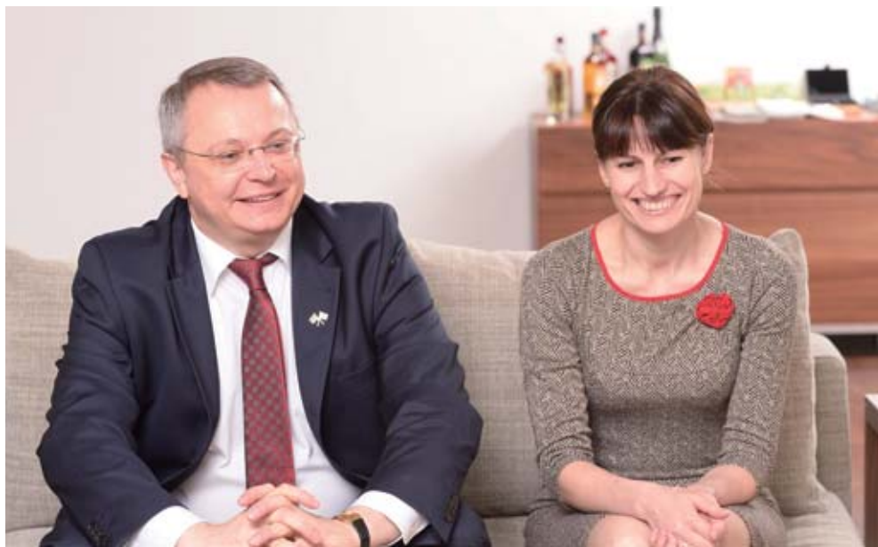
夫人のガリナさん(右)と。

リトアニア共和国 面積: 6.5万平方キロメートル 人口: 297.2万人(2013年:リトアニア統計局) 首都: ヴィリニユス 言語: リトアニア語 元首: ダリア・グリボウスカйте大統領 議会: 一院制(議席数141、任期4年)