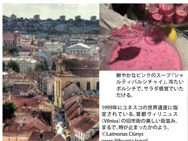
鮮やかなピンクのスープ『シャルティバルシチャイ』。冷たいボルシチで、サラダ感覚でいただける。

http://jp.mfa.lt/index.php?3592445785 (日本語)