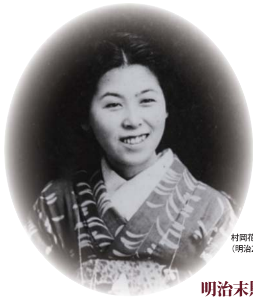
村岡花子 旧姓安中はな (明治26年(1893) 6月21日 - 昭和43年(1968) 10月25日)

2014年上半期のNHKの連続テレビ小説「花子とアン」は、「赤毛のアン」の日本語翻訳者である村岡花子(明治26年(1893)～昭和43年(1968))の半生を描いた「アンゆりかご一村岡花子の生涯」(村岡恵理著 新潮社)を原案としている。村岡花子(安中はな)は、麻布鳥居坂の東洋英和女学校(現東洋英和女学院)で、明治36年(1903)から大正2年(1913)まで過ごした。花子が麻布で過ごした10年間の軌跡、腹心の友、白蓮との出会い、童謡「赤い靴」のモデルとなった佐野きみとの不思議な巡り合わせを2回にわたって辿ってみる。