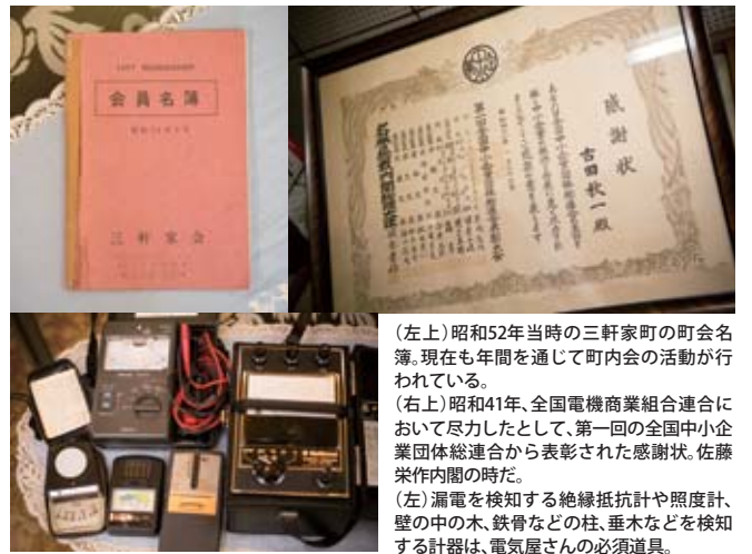
(左上)昭和52年当時の三軒家町の町会名簿。現在も年間を通じて町内会の活動が行われている。 (右上)昭和41年、全国電機商業組合連合において尽力したとして、第一回の全国中小企業団体総連合から表彰された感謝状。佐藤栄作内閣の時代。 (左)漏電を検知する絶縁抵抗計や照度計、壁の中の木、鉄骨などの柱、垂木などを検知する計器は、電気屋さんの必須道具。