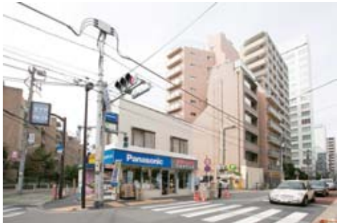
旧テレ朝通りの「愛育病院前」の信号の前にある店は、近隣の人にはおなじみ。