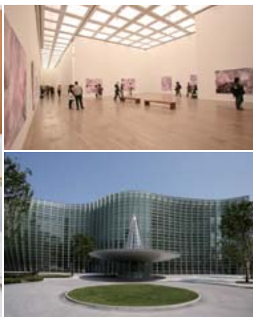
(右上)国立新美術館「光 松本陽子・野口里佳」展示風景 (右下)国立新美術館外観(正面)