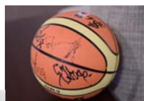
リトアニアで最も有名なバスケットボール。過去にヨーロッパ選手権を3回制覇。2014年はフランスに続き2位。NBAでも多くの選手が活躍中だ。写真のボールは2006年のナショナルチームのサイン入りの「お宝バスケットボール」。