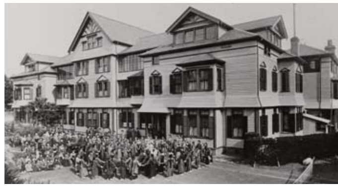
花子が過ごした時代の校舎 木造4階建て、建坪650坪(付属建物を含む)の堂々たる建物である。西洋の先生方の住居とつながっており、1階は、教室、食堂、校長室、教員室など、2階と3階が生徒たちの宿舎、4階が祈祷室となっていた。花子は2階の一室で生徒達数人と住んでいた。当時全校生徒数は約200人、寄宿舎生と通学生生の割合はほぼ半々であったという。

2014年上半期のNHKの連続テレビ小説「花子とアン」は、「赤毛のアン」の日本語翻訳者である村岡花子(明治26年(1893)～昭和43年(1968))の半生を描いた「アンゆりかご一村岡花子の生涯」(村岡恵理著 新潮社)を原案としている。村岡花子(安中はな)は、麻布鳥居坂の東洋英和女学校(現東洋英和女学院)で、明治36年(1903)から大正2年(1913)まで過ごした。花子が麻布で過ごした10年間の軌跡、腹心の友、白蓮との出会い、童謡「赤い靴」のモデルとなった佐野きみとの不思議な巡り合わせを2回にわたって辿ってみる。