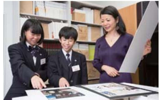
過去に行われた展覧会のポスターを見て「ボツになった方のデザインも捨てがたいなあ」といった表情の2人

展示の内容や配置を考える時です。ストーリーを考えながら展示会場のレイアウトを図面にし、その後立体模型を作るなどして確認します。また、作品の保全を考慮し