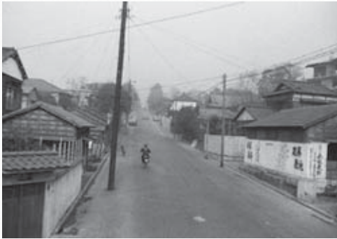
昭和34年 坂道の長さが百六十間(288m)もあり、坂の名はそのために付いた。写真右に見えるのは、当時平屋建てであった「永坂更科」。