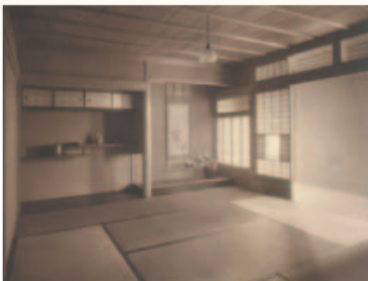
西洋建築ながらも、本格的な造作の和室が設けられているのが興味深い。