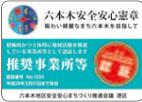
認証した推奨事業所等へ送付する認証ステッカー

この取組の一環として実施している港区「六本木安全安心憲章」推奨事業所等認証制度は、憲章の趣旨に賛同する店舗・事業所等(以下事業所等)を募集し、その中から、積極的に地域活動に取り組む事業所等を推奨事業所等として認証するものです。平成27年度は、賛同された307件(募集時点)の賛同事業所等の中から、4件の事業所等を新規認証し、13件の事業所等を更新認証することに決定しました(表参照)。