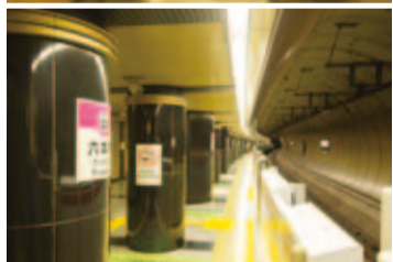
六本木駅構内全体が黒と金色で統一されている。膨大な情報の波動を「空気振動で音を奏でる管楽器」になぞらえてデザインされたそう。