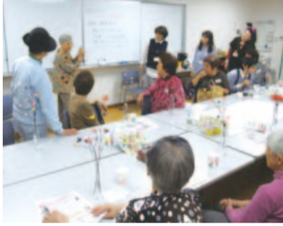
ちょこっと立ち寄りカフェは毎月実施しています。

高齢者が、住み慣れた地域で孤立することなく、安心して自分らしくいきいきと生活できるよう気軽に集い学べる場を提供するとともに、地域におけるボランティアを養成し、地域住民が互いに支え合う仕組みづくりを支援します。