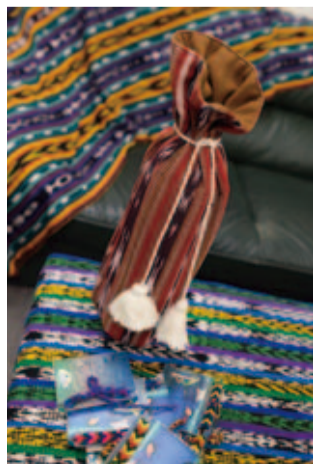
グアテマラの色濃い自然と人々の素朴で明るいエネルギーを映し出したような手織物。女性たちが紡ぎ出す色彩と手織りの風合いが瓶を優しく包み込む。