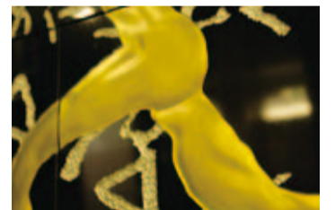
同じ深さに掘っても表面のツルツル、ザラザラによって金箔の光沢が全く違って見える。