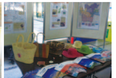
大使館よりの展示物