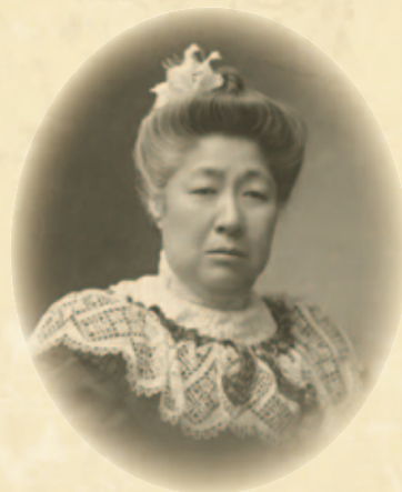
実業家としての威厳に満ちた浅子の肖像

大正から昭和にかけての麻布区材木町63番地、現在の六本木6丁目、六本木ヒルズハリウッドビューティープラザの辺りに広岡家の邸宅があった。平成27年度後期連続テレビ小説「あさが来た」(NHK)のモデルとして描かれた広岡浅子とその娘夫婦一家が、本拠地の大阪のほかに、東京で過ごすためにつくった別邸だ。どのような建物であったのかを調べつつ、広岡家の人たちに思いを馳せた。