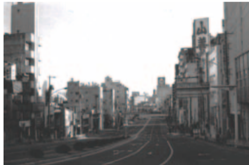
昭和50(1975)年:土器坂上から