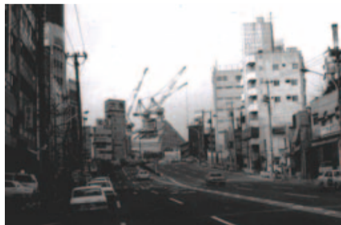
昭和50(1975)年:土器坂下から