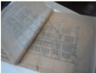
間取図、立面図などの原図が大切に保存されている。