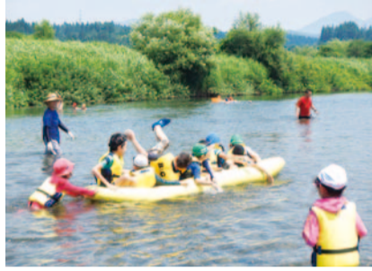
地元の子ども達との川遊びの様子

地域の人々が主体的に続けてきた地方都市との地域間連携活動を側面支援するとともに、区民の方々に交流活動に関わる機会を増やします。また、児童に豊かな自然を体験する機会を設け、情操と見識を育み、健全な育ちを促す取組を実施します。