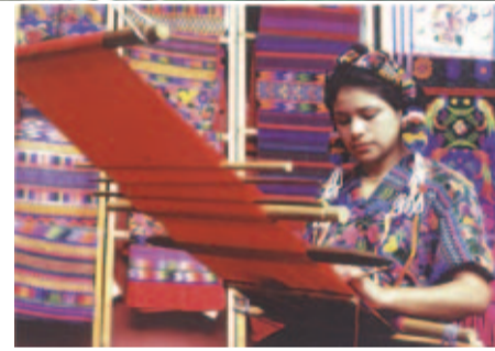
マヤ文明の伝統は織物文化に息づいている

残念ながら、日本にはグアテマラ料理を提供するレストランはありません。ペルー料理店で、グアテマラ料理に似た料理を出す店は発見済みです。反対に、私たちが現地へ行ったら、ぜひ食べておくべきメニューを3品教えていただきました。「タマル(TAMAL)」はトウモロコシの粉を団子状に練り、肉やトマトソースといっしょにバナナの葉などでくるみ、蒸したり、煮たりしたものです。トウモロコシの代わりにお米で作ることもあります。「ペピアン(PEPIAN)」は唐辛子、スパイス、トマトなどを焼いてからミキサーにかけ、ソースにします。これをベースに野菜や肉をいっしょに煮込んだスパイシーな1品です。