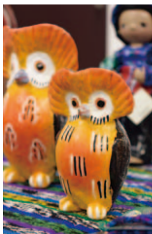
グアテマラで幸運や繁栄の象徴で縁起が良いとされるふくろう。丁寧に色づけされた陶器の中には、貯金箱として使用されるものがあるという。