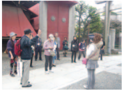
基礎講座(歩学)の様子

麻布地区の魅力が高めるための活動を担う人材の発掘・養成します。また、講座修了者が麻布地区をより魅力的にするための自主的な活動を展開できるように支援します。