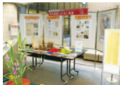
マダガスカル共和国パネル展示の様子

マダガスカルはアフリカ大陸の東、インド洋に位置する島国です。島固有の動植物が数多く存在し、世界最大のバニラの輸出国でもあります。パネル展示ではそんなマダガスカルの魅力をご紹介します。