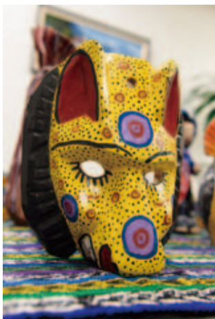
色鮮やかにペイントされた木製の仮面(犬)は手作り、元々はお祭りで使われる。動物のモチーフやスペイン人などの仮面もあり、アートとしても楽しめる。

そして、大使が一番好きな「フリホレス(FRIJOLAS)」。 インゲン豆の一種で日本では入手困難な黒色の豆(赤の豆でも可)を使った料理。乾燥豆を蒸してペースト状にしたものと、玉ねぎを炒めた伝統料理です。豆料理は日本では甘いイメージがありますが、グアテマラは塩味です。母国の味、たとえばフリホレスを思い出す、と大使。