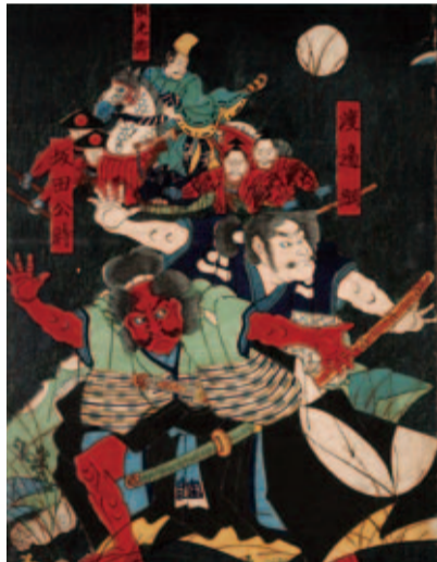
歌川芳艶「渡辺綱」「頼光卿」「坂田公時」(1861年)「舞鶴市糸井文庫」蔵

「江戸砂子」に、「かはらけ町の坂也、むかし渡辺綱三田にありし時、此所を過るに馬工郎の引ける馬を見てもとめたり、此馬驢毛にして類ひなき名馬也、それより驢毛坂といふといへりいつのほにか土器坂といひ土器町といふ也、本名飯倉町也」とある。