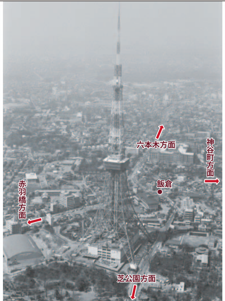
現在の様に高層ビルが立ち並ぶ前の東京タワー(芝方面)からの麻布地区(六本木方面)の様子。写真下側東京タワー左手が土器坂下になる。写真中央右側にある大きな建物は現在の麻布郵便局。土器坂下付近に都電が走っている様子が見て取れる。昭和38(1963)年撮影:東京都提供