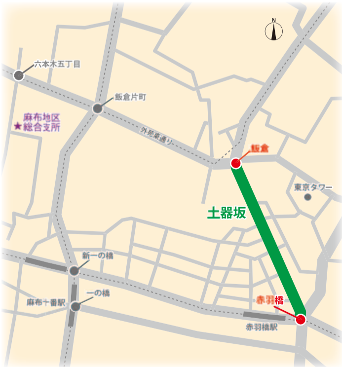
「赤羽橋」側が坂下で南側、「飯倉」が坂上で北側となる。

●参考文献/目で見える港区の100年 郷土出版社刊 加藤 征子・清田 和美・野々山 毅/著 続・麻布の名所今昔 (株)永坂更科刊 俵 元昭・佐藤 明・岩崎 和夫・源 友雄・村岡 淳/編(※非売品)