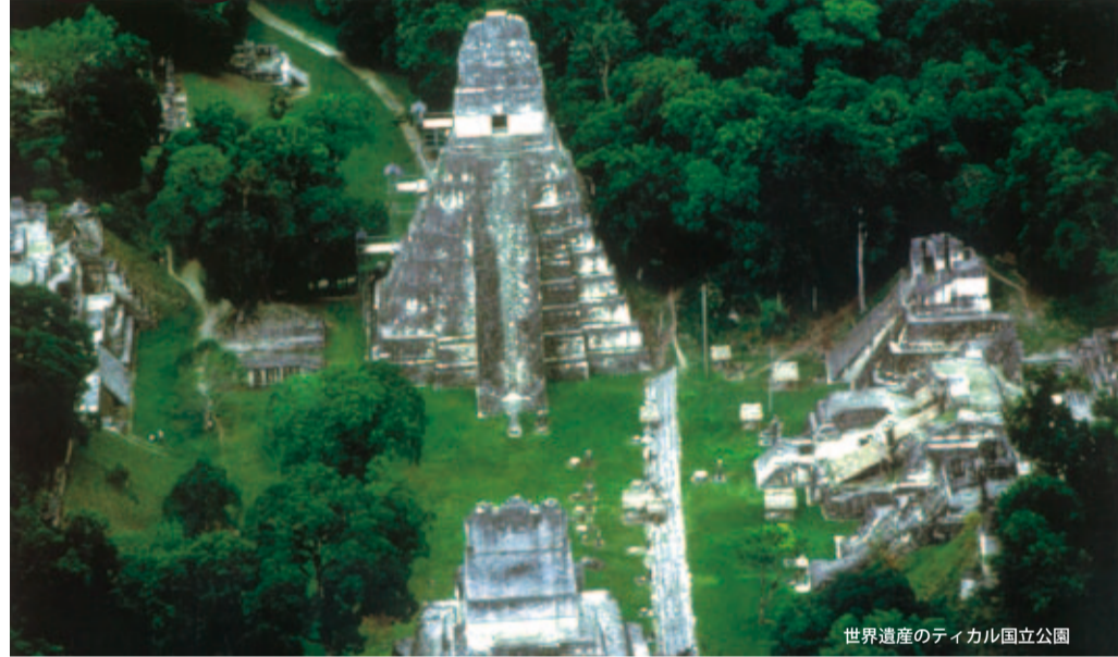
世界遺産のティカル国立公園

日本の生活のすべてに前向きな大使は、日本食にも興味津々です。寿司では、まぐろやサーモンが好物。でもイクラは苦手、生卵と納豆も、と身振り手振りで素直な感想を述べられました。寿司以外はどうかが大好きとも。