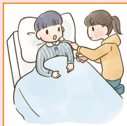
障害や病気のある家族の身の回りの世話をしている。