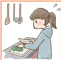
障害や病気のある家族に代わり、買い物・料理・掃除・洗濯などの家事をしている。

「ヤングケアラー」とは、本来大人が担うような家族のケア（家事、介護、きょうだいの世話、感情面でのサポートなど）を日常的に行っている18歳未満の子どものことをいいます。