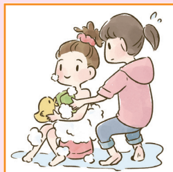
障害や病気のある家族の入浴やトイレの介助をしている。