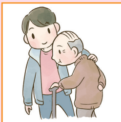
目の離せない家族の見守りや声かけなどの気づかいをしている。