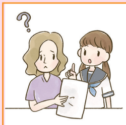
日本語が第一言語でない家族や障害のある家族のために通訳をしている。