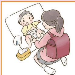
家族に代わり、幼いきょうだいの世話をしている。