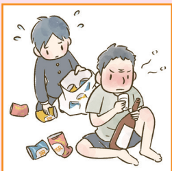
アルコール・薬物・ギャンブル問題を抱える家族に対応している。