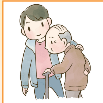
目の離せない家族の見守りや声かけなどの気づかいをしている。