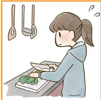
障害や病気のある家族に代わり、買い物・料理・掃除・洗濯などの家事をしている。