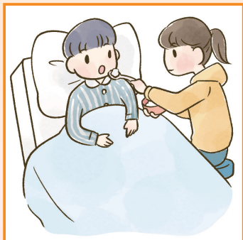
障害や病気のある家族の身の回りの世話をしている。