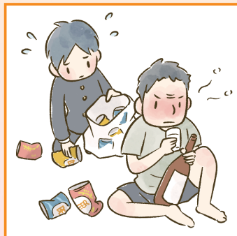
アルコール・薬物・ギャンブル問題を抱える家族に対応している。