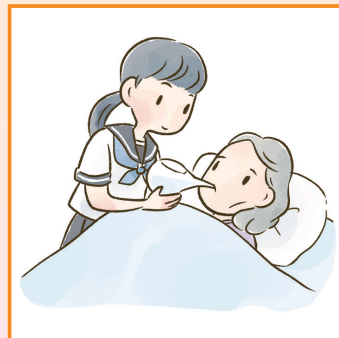
がん・難病・精神疾患など慢性的な病気の家族の看病をしている。