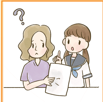
日本語が第一言語でない家族や障害のある家族のために通訳をしている。