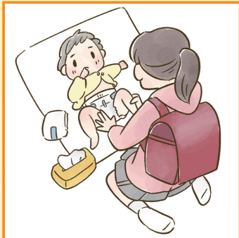
家族に代わり、幼いきょうだいの世話をしている。