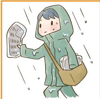
家計を支えるために労働をして、障害や病気のある家族を助けている。