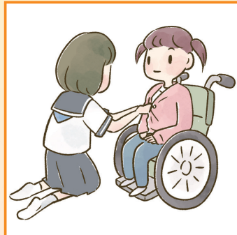
障害や病気のあるきょうだいの世話や見守りをしている。