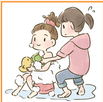
障害や病気のある家族の入浴やトイレの介助をしている。