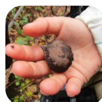
見て、触って楽しみました