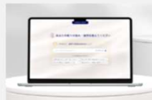
相談ブース内に『nemuso』設置