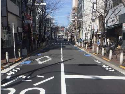
自転車ネットワーク

区は、自転車への交通反則通告制度（青切符）の適用に伴い、自転車利用者の安全確保を図るとともに、中東情勢を背景としたガソリン価格の高騰等を見据え、ガソリン等に依存しない行動変容に対応するため、自転車通行空間の整備を推進します。