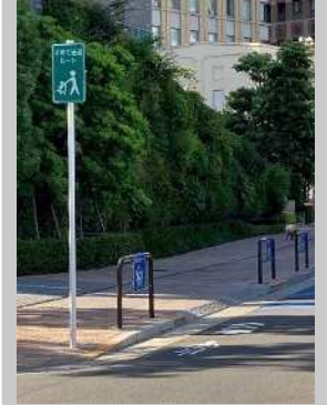
子育て送迎ルート

区では、出発地から目的地まで、安全・安心で快適につながる自転車通行空間・通行環境の実現に向け、区内の自転車ネットワークの早期構築を目指し、計画的に自転車通行空間の整備を進めています。また、子ども乗せ自転車による送迎においても安全かつ安心して通行できるように、子育て施設周辺の区道を対象に、子育て送迎ルートの整備を推進しています。