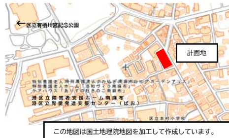
この地図は国土地理院地図を加工して作成しています。