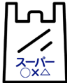
ビニール袋・お菓子の袋など