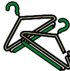
その他のプラスチック製品 (ハンガー・おもちゃ・日用品) など