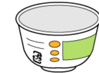
カップ麺などの容器