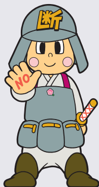
リデュースキャラクター だんじろう