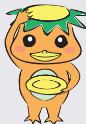
リユースキャラクター リユー助