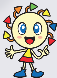
リサイクルキャラクター エコル