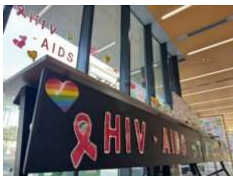
区内大学学園祭へのブース出展

あわせて、定期的に感染症に関する普及・啓発を重点実施する「予防月間」等の機会を活用するとともに、区内の教育機関などと連携した広報や健康教育を行うなど、多様なコミュニティを通じた情報伝達により、効果的に普及・啓発を行います。