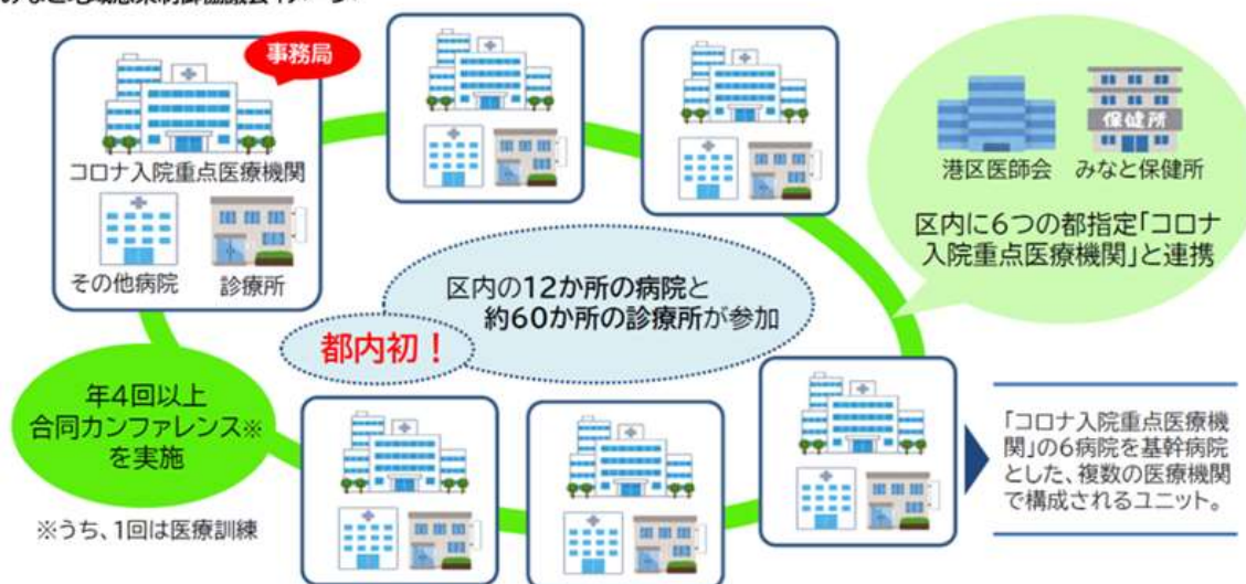
みなと地域感染制御協議会イメージ

M I C Cは「Minato infection control council」の略です。