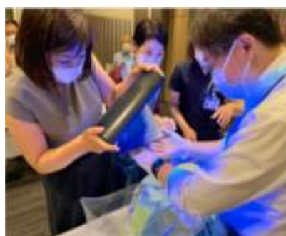
M I C Cの感染対策訓練 排泄物処理手技訓練の様子