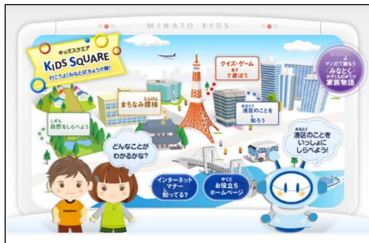
現在のキッズスクエア