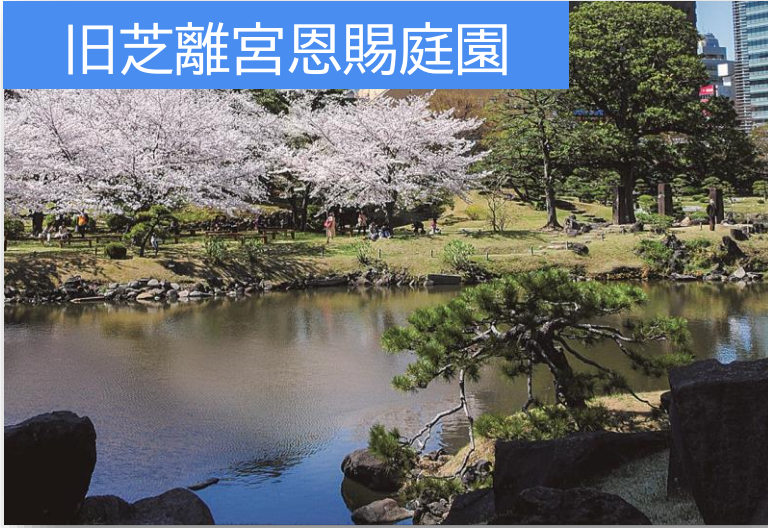
旧芝離宮恩賜庭園