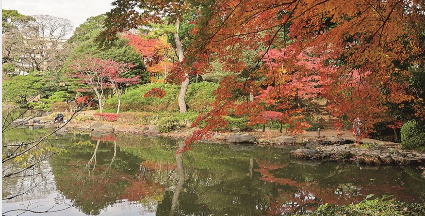
有栖川宮記念公園