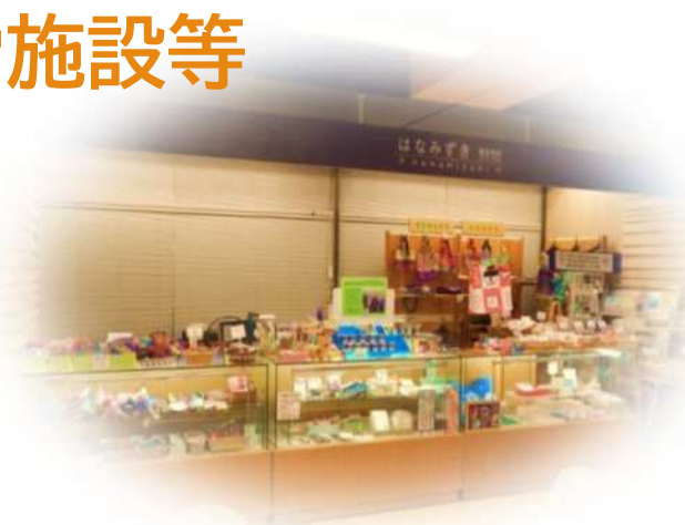
区役所1階 福祉売店はなみずき