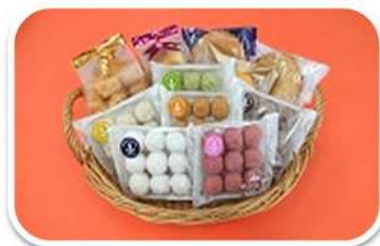
お菓子の注文も承っております。