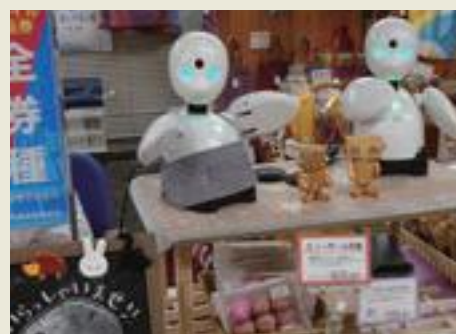
分身ロボットを活用した障害者の就労支援