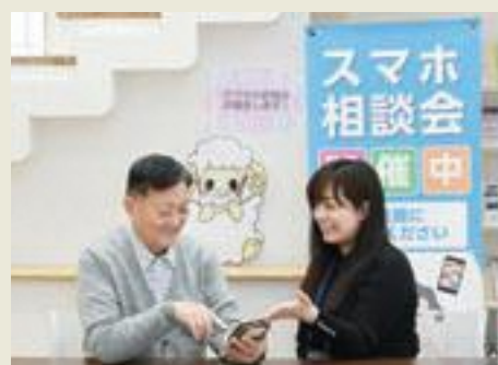
高齢者のデジタルの活用を支援