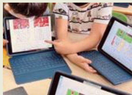
授業でデジタル教科書を活用