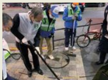
六本木安全安心プロジェクトでガム痕を除去