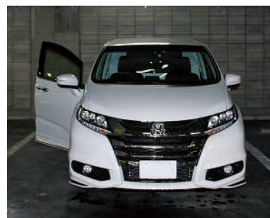
患者搬送用の車両 (本田技研工業株式会社から無償貸与)