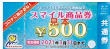
プレミアム付き区内共通商品券