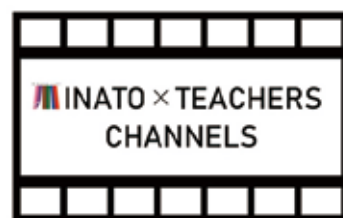
授業動画 「MINATO x TEACHERS CHANNELS」