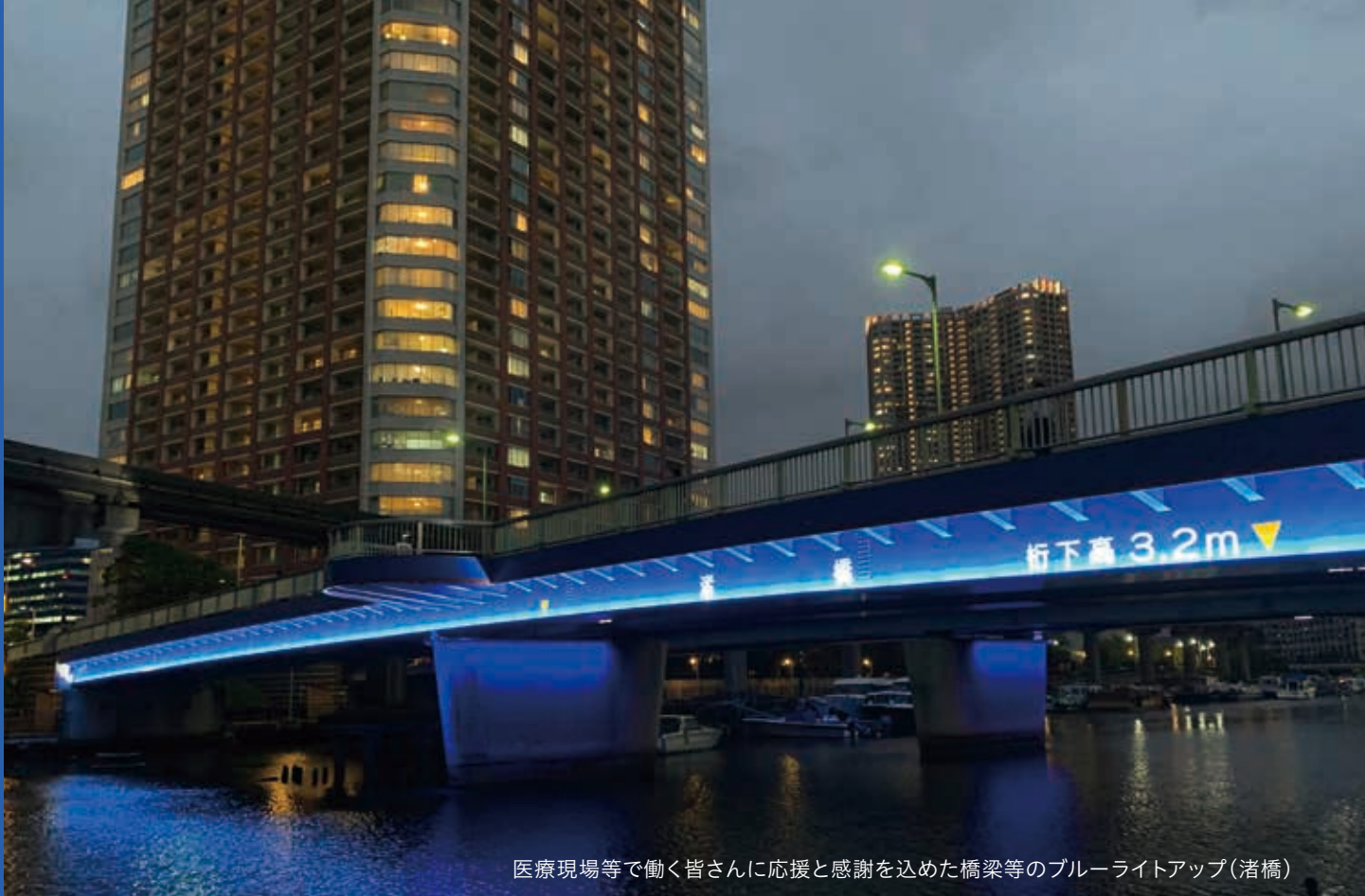
医療現場等で働く皆さんに応援と感謝を込めた橋梁等のブルーライトアップ(渚橋)