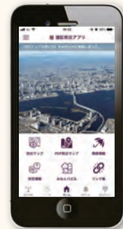
「港区防災アプリ」 トップメニュー

スマートフォン向けアプリ「港区防災アプリ」から、各種ハザードマップ等の防災関連情報を確認できます。詳しくは、P.13をご覧ください。