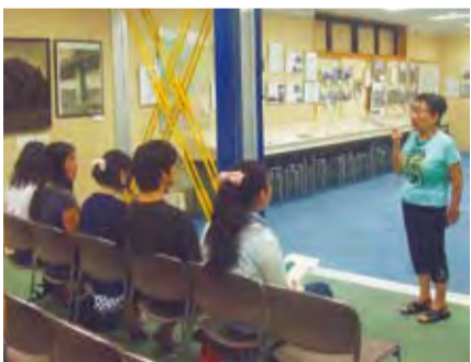
戦争体験者から体験談を聴く港区平和青年団員