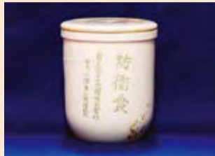
磁器製防衛食容器

上の写真は軍事郵便の印章です。戦争が激しくなるにつれ、国民の思想や言論統制は厳しさを増していきます。中でも、軍関係者に対してはより厳しくなり、軍関係者が送る、あるいは軍関係者に送られる郵便には必ず検閲が加えられていました。その際、検閲済みの郵便物に押されたのが軍事郵便の印です。