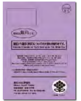
表1 まだがん検診を受けていない人へ

がんは日本人の死因の第1位です。日本人の2人に1人はがんになり、3人に1人ががんで亡くなっています。がん検診によって、初期の段階でがんを発見することで、適切な治療を選択することができます。大切な命を守るために、がん検診を必ず受けましょう。