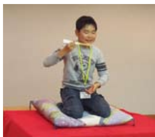
平成27年度のワークショップの様子