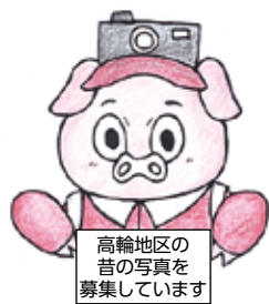
アライ・ブーちゃん