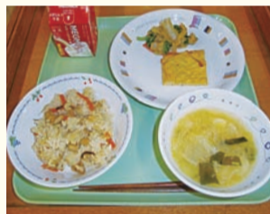
【今回は港南中学校です】