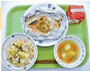
【今回はお台場学園です】