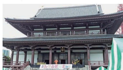
増上寺大殿前ステージ

●増上寺会館前は「福祉部会」が開催され、食べたり、遊んだり、ゆっくりお楽しみいただけます。