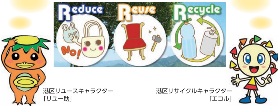
港区リユースキャラクター 「リユース」