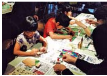
平成27年度のワークショップの様子

区内企業がお届けする環境に関する体験型ワークショップです。見て聞いて作って遊んで、親子で楽しく環境について学びませんか。