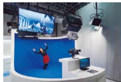
NHK放送博物館 放送体験スタジオ

定員 20人(抽選) その他 歩きやすい靴・服装で参加してください。 費用 無料 申し込み 往復はがき(1人1枚。ただし、ともに60歳以上の夫婦の応募は1枚の往復はがきで応募可)に、(1)ミュージアム巡り参加希望(2)住所(3)氏名(ふりがな)(4)年齢(5)電話番号(夫婦で応募の場合は2人とも(3)(4)を記入)を明記の上、11月30日(水・必着)までに、〒105-0013 浜松町1-6-7 神明いきいきプラザへ。