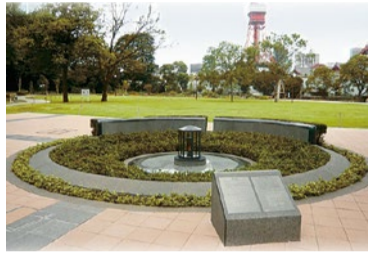
区立芝公園に設置されている「平和の灯」

「平和の灯」は、平成17年度に、港区平和都市宣言20周年の記念事業の一環として、核兵器の廃絶と世界の恒久平和を願い設置されたものです。平和の灯にともされた「火」は、広島市の「平和の灯(ともしび)」、福岡県八女市(旧星野村)の「平和の火」、長崎市の「ナガサキ誓いの火」を合わせたものです。区は、「平和の灯」を通じて、戦争の惨禍と平和の尊さを伝えていきます。