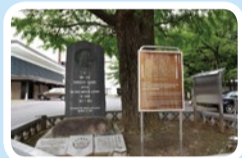
最初のアメリカ公使館跡

辺りです。仙台坂下の停留所でバスを降り、麻布山善福寺を訪れました。参道には、古来より地下から自然と湧き出る泉が、今もなお水をたたえています。関東大震災や東京大空襲時に、この「柳の井戸」が区民の助けとなったそうです。江戸時代末期の安政6年には最初のアメリカ公使館が置かれたところで、静かな境内の木陰に、初代駐日公使として下田からこの地に移ったタウンゼント・ハリスの碑が建てられています。