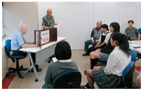
戦争体験者との交流会の様子

平成30年度も、公募で選ばれた4人の高校生が、長崎への派遣研修や戦争体験者との交流会を通じて平和について学びます。学習した成果は、8月25日(土)開催の「平和のつどい」で報告します。