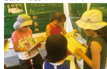
ふれ愛まつりでのミツバチクイズ

この事業で採れたハチミツについては、放射能測定を実施しており、放射性ヨウ素、放射性セシウムの不検出が確認されています。