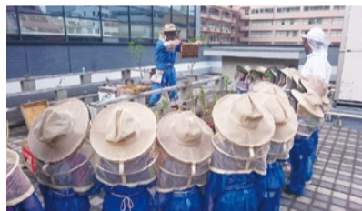
保育園児の養蜂現場見学