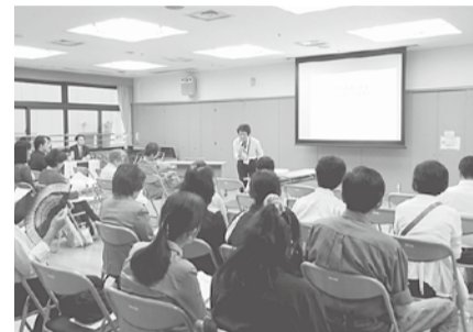
平成29年度の区民公開講座の様子