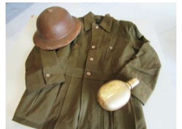
ミニ平和展セット(Aセット・衣)