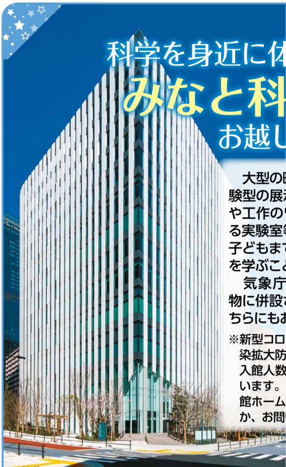
みなと科学館外観

※新型コロナウイルス感染症の感染拡大防止のため、事前予約や入館人数制限等を行い運営しています。詳しくは、みなと科学館ホームページをご覧ください。お問い合わせください。