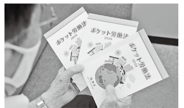
見本としてポケット労働法2019版を掲載しています