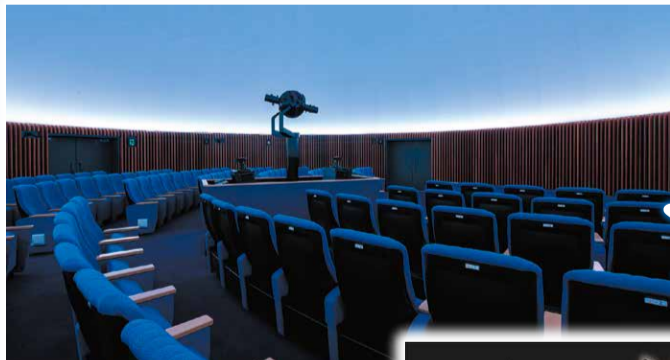
プラネタリウムホール

料金 施設内入館無料。プラネタリウムのみ有料 一般投影(一回分) 大人600円、小・中学生、高校生100円 年間利用券 大人2000円、小・中学生、高校生300円 ※未就学児、区内在住の65歳以上の人、区内在住の障害者およびその介護者(1人)は無料です。