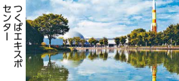
つくばエキスポセンター

つくば市は港区との関わりが長く、区のイベント「みなと区民まつり(令和2年中止)」、「全国交流物産展in新橋」に参加している他、食材を通じて自治体間交流を進める「全国連携マルシェ」にも参加しています。