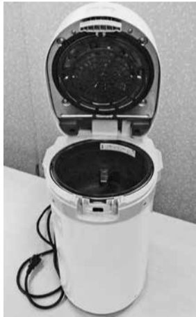
家庭用生ごみ処理機例