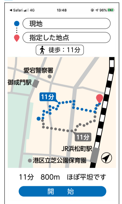
実際は道路状況等災害状況に応じた避難経路の安全に十分注意の上、避難してください