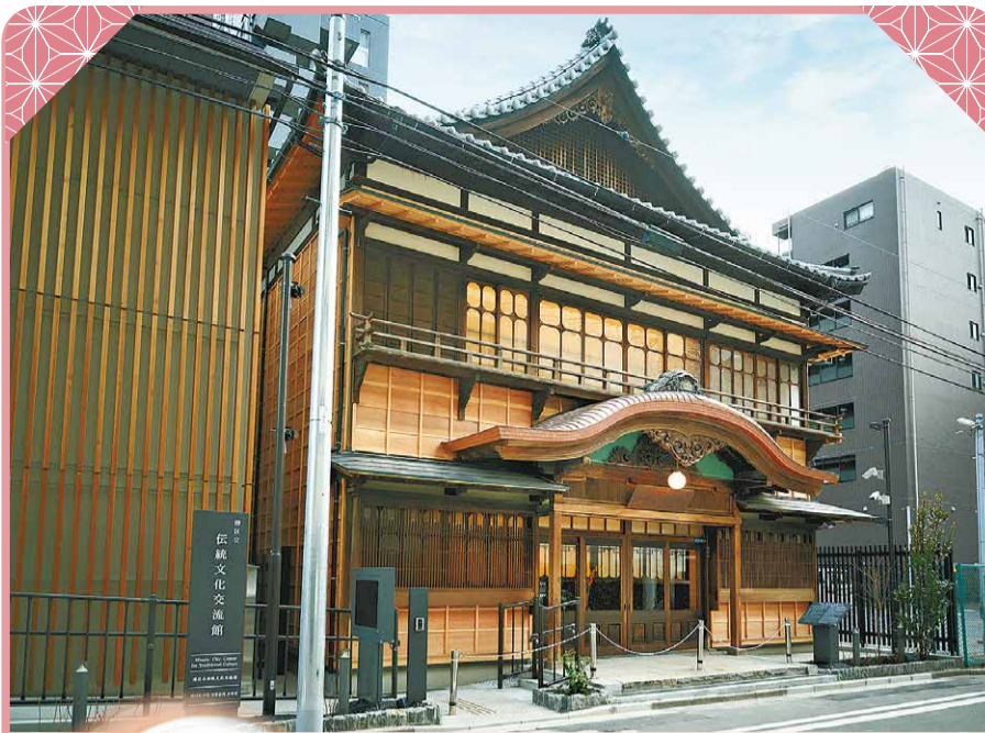
伝統文化交流館外観