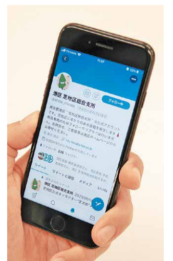
ツイッターの画面イメージ

二次元コードをスマートフォンで読み取ると、港区ホームページの港区公式SNSについてのページをご覧ください。