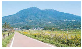
筑波山とつくば霞ヶ浦りんりんロード

茨城県南部に位置するつくば市は、つくばエクスプレスで秋葉原駅から最速45分、学術・研究機関が集まる「筑波研究学園都市」として知られ、市北部には日本百名山、日本百景、日本ジオパークに選ばれている筑波山(標高877メートル)があり、数多くの観光客が訪れます。