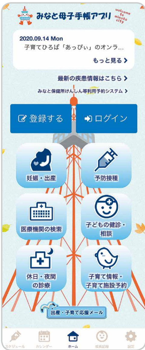
みなと母子手帳アプリのトップページ画面

みなと保健所で実施する乳幼児健診等の一部の母子保健事業は、3密を避けるために、現在、定員枠を設け、完全予約制で実施しています。 利便性を向上させるために、6月1日から開始した「みなと母子手帳アプリ」に予約機能を新たに搭載して、健診の予約や日程変更等を簡単にできるようにしました。