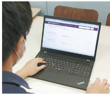
パソコンでもスマートフォンでもご覧いただけます