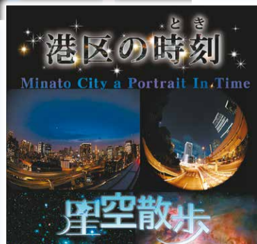
プラネタリウム番組 港区の時刻