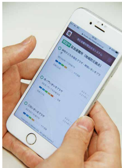
混雑状況案内画面