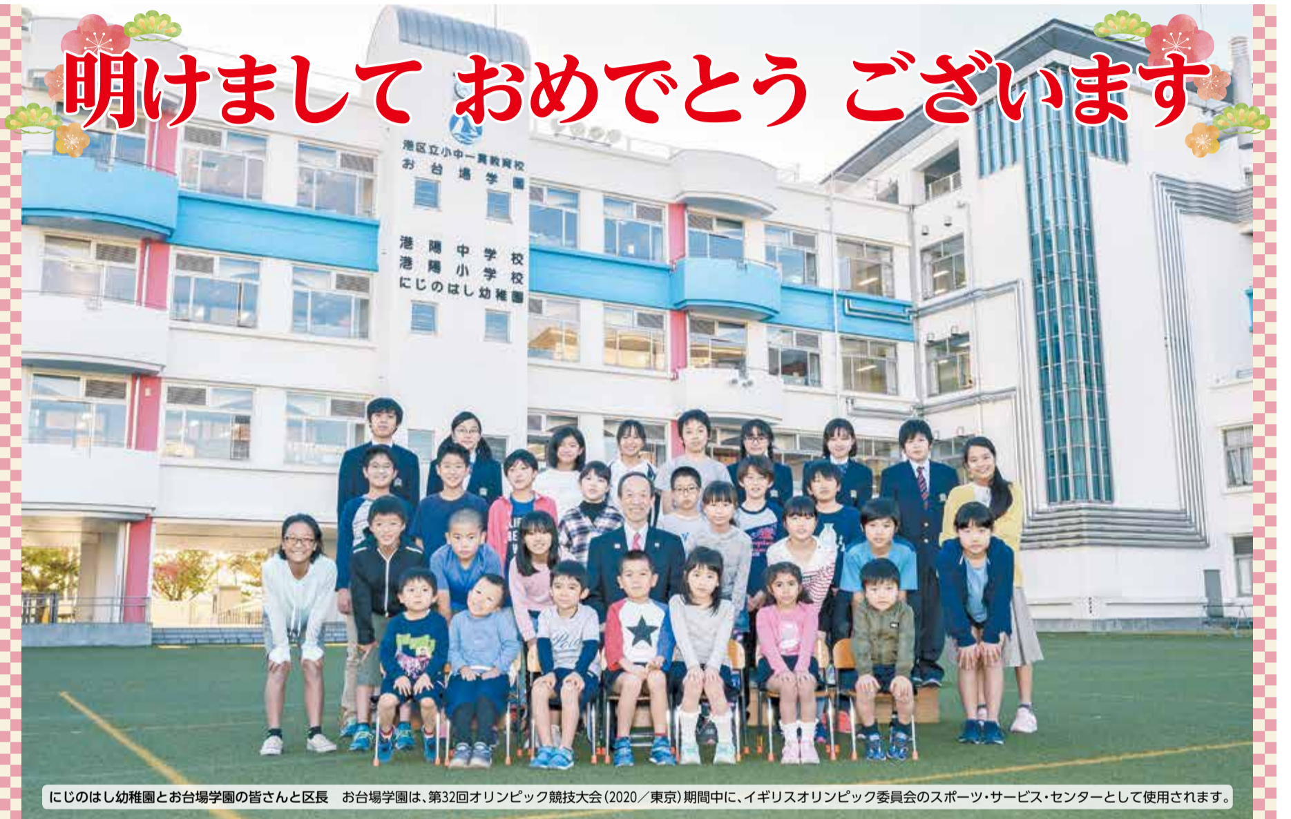
にじのはし幼稚園とお台場学園の皆さんと区長 お台場学園は、第32回オリンピック競技大会(2020/東京)期間中に、イギリスオリンピック委員会のスポーツ・サービス・センターとして使用されます。