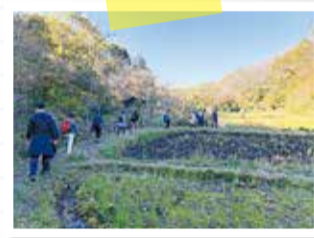
校外学習の様子 (横浜市 舞岡公園)