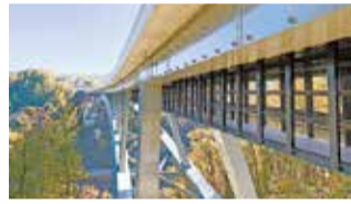
三遠南信自動車道「天龍峡大橋」