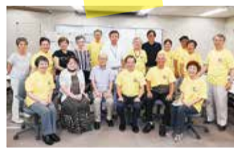
夏の子ども会サイエンス講座 参加スタッフ

みなと区民まつりや港区地域福祉フォーラムへの参加、芝・麻布・赤坂・高輪・芝浦港南の地域単位での活動等があります。詳しくはCCクラブのホームページをご覧ください。