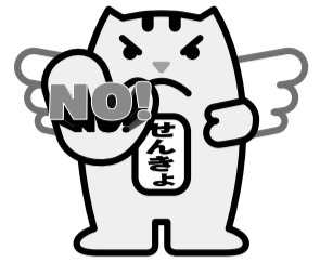
贈らない・求めない・受け取らない

夏祭りやお中元等で寄附が行われやすいことを考慮し、8月31日(月)までの期間を寄附禁止PR強化期間としています。 政治家が選挙区内の人に、お金や物を贈ることは、法律(公職選挙法)で禁止されています。違反すると、処罰されます。また、有権者が寄附を求めることも禁止されています。 寄附禁止のルールを守って、明るい選挙を実現しましょう。