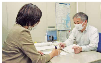
相談コーナーの様子(イメージ)