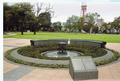
区立芝公園に設置されている「平和の灯」

「平和の灯」は、平成17年度に、港区平和都市宣言20周年の記念事業の一環として、核兵器の廃絶と世界の恒久平和を願い設置されたものです。平和の灯にともされた「火」は、広島市の「平和の灯」、福岡県八女市(旧星野村)の「平和の火」、長崎市の「ナガサキ誓いの火」を合わせたものです。区は、「平和の灯」を通じて、戦争の惨禍と平和の尊さを伝えていきます。