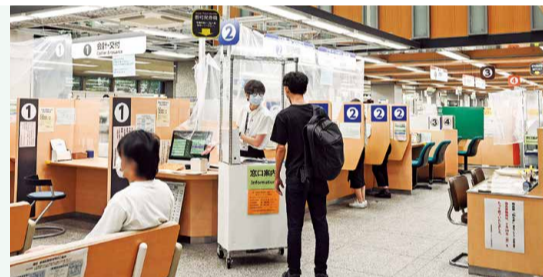
芝地区総合支所区民課窓口

コンビニ交付サービスを利用するには、マイナンバーカード(個人番号カード)または住民基本台帳カードと暗証番号の登録が必要です。利用を希望する人はあらかじめ、最寄りの総合支所区民課窓口サービス係で手続きしてください(港区に住民登録のある人に限ります)。コンビニエンスストアでは、従業員を介さず手続きができ、住民票の写しや各種証明書等を取得できます。証明書の用紙には偽造・改ざん防止対策が施されています。