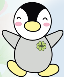
東京都民生委員・児童委員キャラクター「ミンジー」