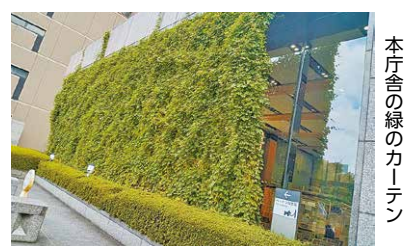
本庁舎の緑のカーテン

緑のカーテン用の苗の配布会は、5月21日(土)に開催するエコライフ・フェアMINATO2022内で実施します。詳しくは、港区ホームページをご覧ください。