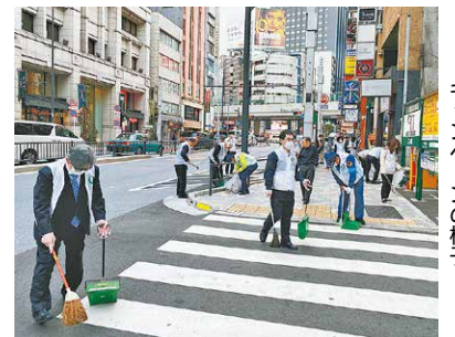
キャンペーンの様子

六本木のまちが好きな人、ボランティア活動に興味がある人、どなたでも参加できます。一緒に充実した