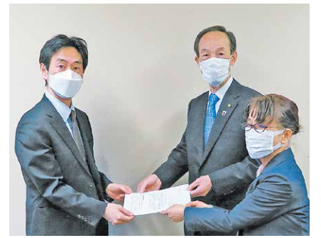
国への要望書の提出の様子

区では、区内のエレベーターに戸開走行保護装置等の安全装置を設置する費用の一部を助成する制度を設けています。詳しくは、建築課建築設備担当にお問い合わせください。