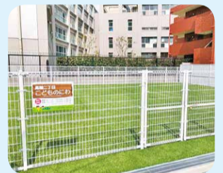
高輪二丁目 こどものにわ