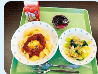
商店街コラボメニューの 学校給食