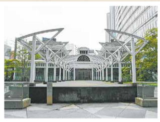
旧新橋停車場 プラットホーム

令和4年は日本初の鉄道が開業して150年です。1872(明治5)年10月14日、新橋～横浜間が開通しました。「陸蒸気」と呼ばれた機関車が約29キロメートルを53分程かけて走りました。煙を上げながら走るその様子に人々は驚き、まさに文明開化の象徴といえる光景でした。