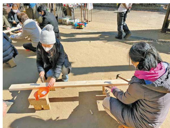
工具を使っている様子