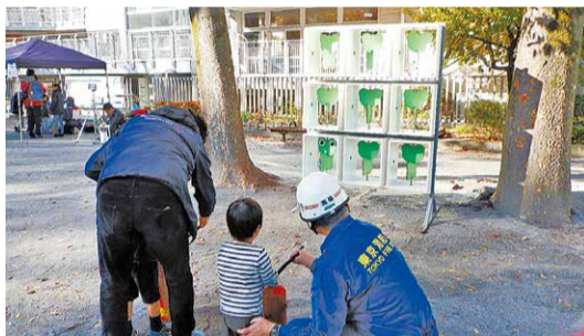
令和元年度 子ども防災イベントの様子