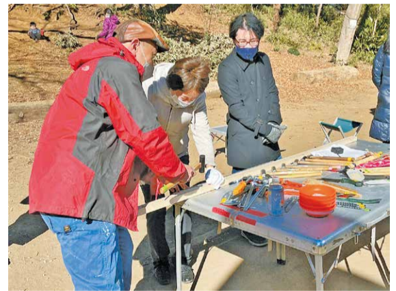
工具の使い方を学ぶ様子