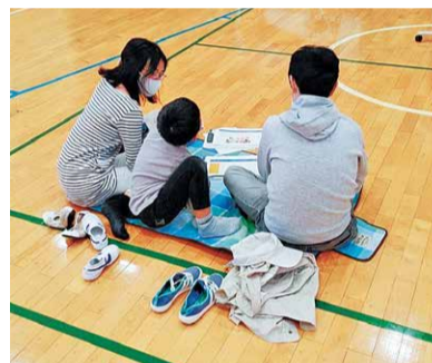
家族でワークショップを受けている様子

ところ 青山中学校1階多目的ホール ※オンラインツール(Zoom)での参加も可。申し込み受け付け後、参加URLを送付します。