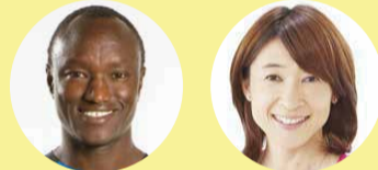
エリック・ワイナイナさん マラソンランナー 谷川真理さん マラソンランナー