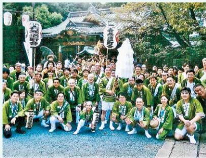
金王八幡宮例大祭の集合写真

青山表参道町会では、青山表参道商店会と協力しながらさまざまな地域活動を行っています。毎月第2・4金曜には表参道駅周辺を清掃し、赤坂地区総合支所主催のクリーンキャンペーンと合同で清掃活動を実施する等、地域の環境美化活動を積極的に行っています。 例年7月には青山表参道商店会と協賛して、青山善光寺で謝恩納涼盆踊り大会を開催しています。盆踊りを楽しむ人たちが、外国人も多く集まり大変な賑わいになります。 最近では青山表参道町会の公式ホームページを開設し、町会の情報発信に力を入れています。地域住民、地域商店、多世代がつながり、住み続けたいと思える楽しく明るいまちづくりをめざし、日々地域活動に取り組んでいます。