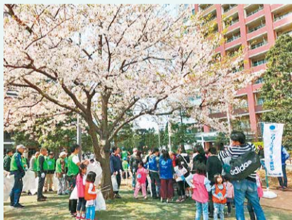
多くの住民でにぎわう清掃活動の様子

芝浦地区にある芝浦アイランド自治会は、4棟の超高層タワーマンションを中心とした、約4000世帯(約1万人)が居住する、全国最大規模の自治会です。定期的に開催している清掃活動では、最大300人近くの参加者が集まり、その他、毎年秋には「島まつり」、定期的な防災・防犯・交通安全活動等、活発に活動しています。 国際化の取り組みも積極的に行っています。自治会SNS・チラシ・自治会会則等、さまざまな情報を多言語化し、外国人居住者も含めた多様な人々が、一緒に活動できるような環境整備を推進しています。