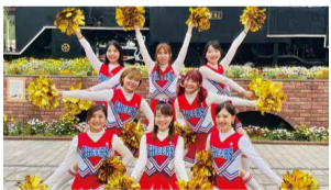
全日本女子チア部☆ AJO