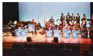
MINATO JAZZ 7th