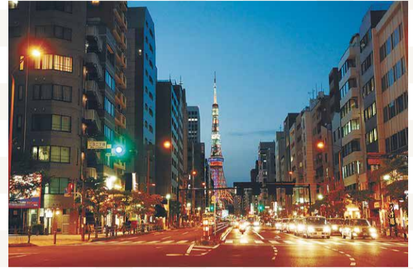
「三田二丁目交差点からの夕暮れの東京タワー」 (第1回(平成29年度)区民景観セレクション受賞景観)