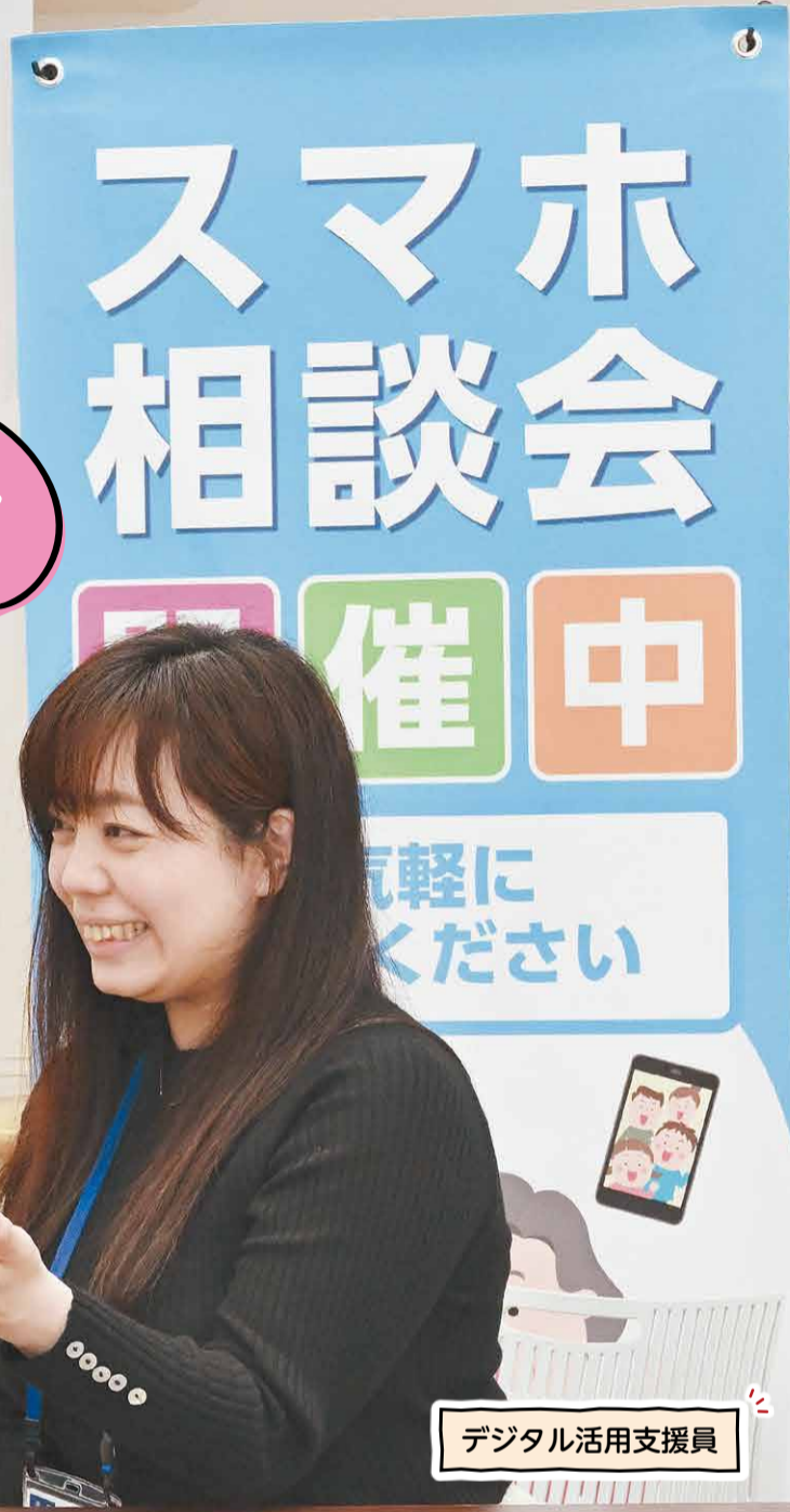
デジタル活用支援員