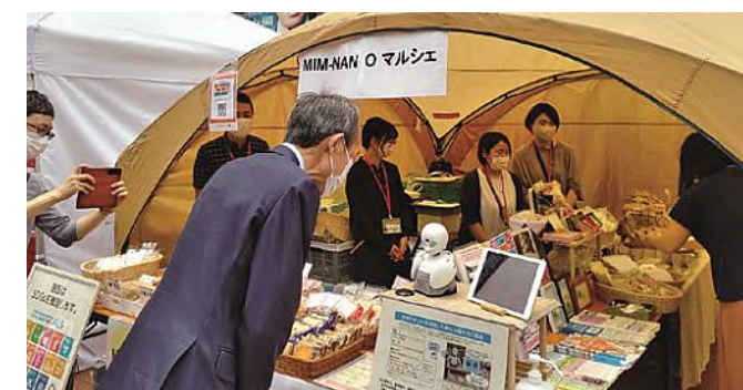
■ 企業等と連携したSDGsの推進 (みなとダイバーシティフェスティバル)