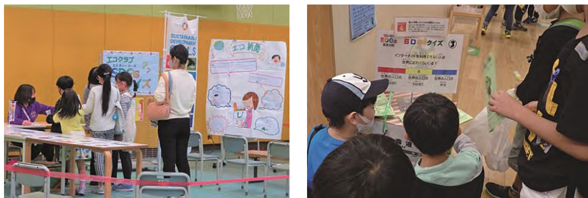
■ 赤坂・青山SDGs月間 (SDGsにちなんだスタンプラリーなど)