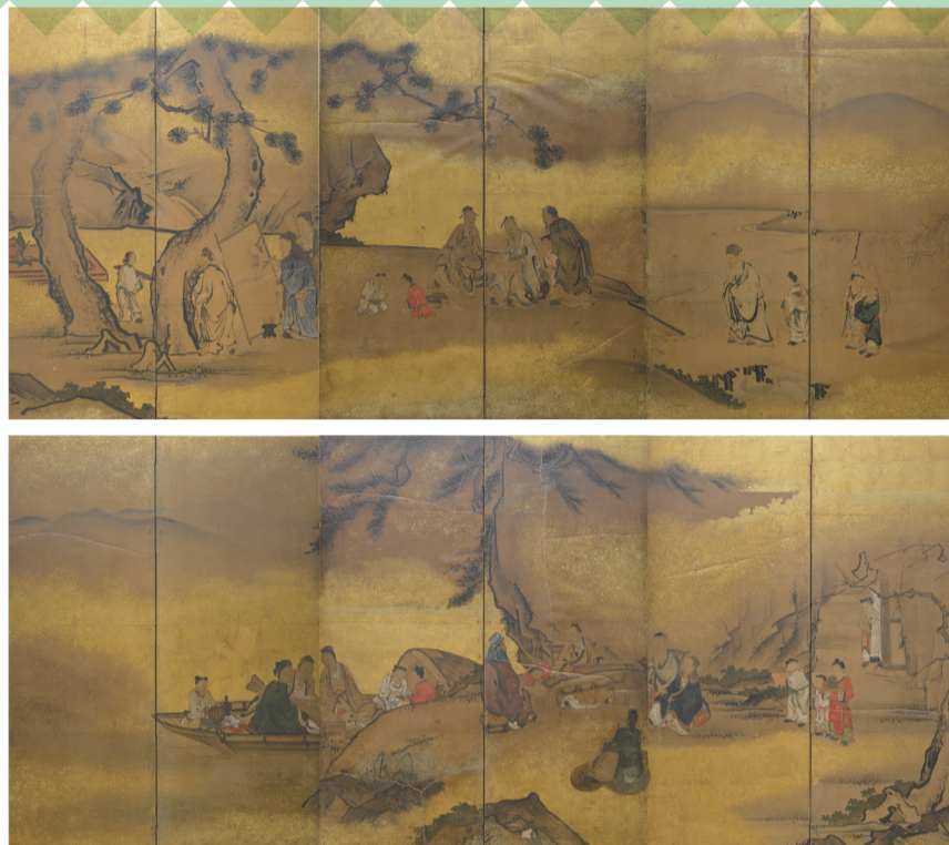
紙本着色琴棋書画図屏風(種徳寺蔵)【パネル展示】