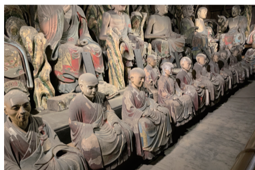
木造歴代人坐像(増上寺蔵)【パネル展示】

港区は歴史的環境に恵まれており、地域の歴史や文化を伝える多くの文化財が残されています。これら貴重な文化財を後世に伝えていくため、毎年数件の文化財を指定しています。本展では令和4年10月に指定された新たな文化財を、パネルを中心に紹介し、地域の文化財と、その保護活動についての理解を深めます。