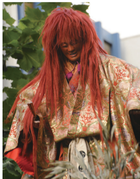
赤坂氷川祭の山車人形 狸々(しょうじょう) (赤坂氷川山車保存会蔵)