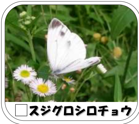
スジグロシロチョウ