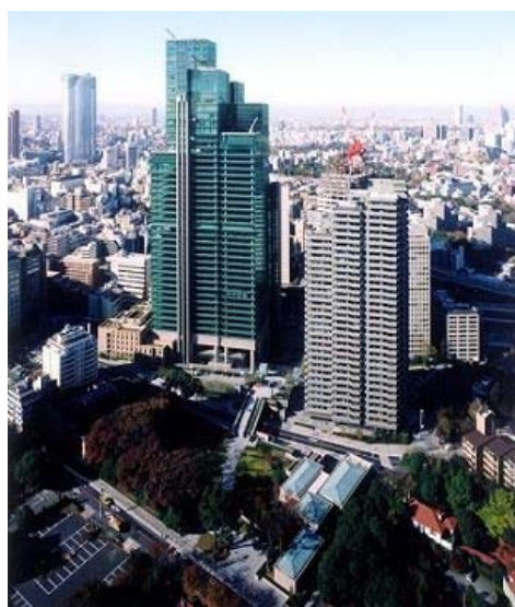
六本木一丁目西地区（完了）

また、都市計画決定まで進んでいる地区が2地区、準備組合等の施行予定者により事業化に向けた検討を進めている地区が10地区あります。