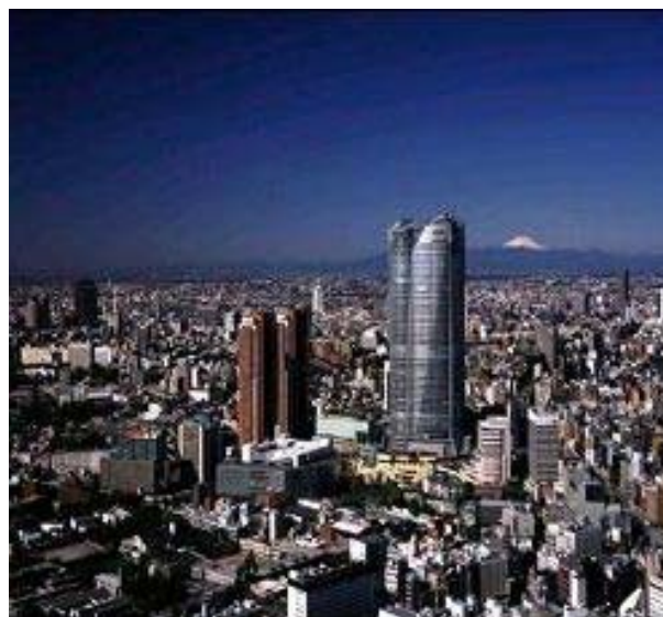
六本木六丁目地区（完了）