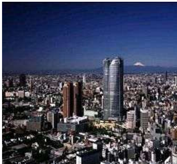
六本木六丁目地区（完了）