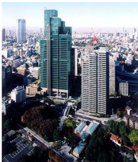
六本木一丁目西地区（完了）

また、都市計画決定まで進んでいる地区が2地区、準備組合等の施行予定者により事業化に向けた検討を進めている地区が10地区あります。