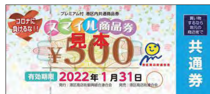
昨年度の商品券の例（港区商店街連合会）