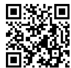
電子申請フォーム (直接一般来館登録)