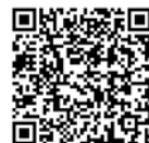
港区ホームページ (子どもふれあいルーム)