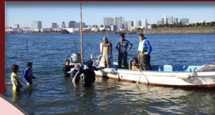
お台場海苔づくりの会及び保護者の方で、ポンプで海底に穴を開け、ひびを設置しました。