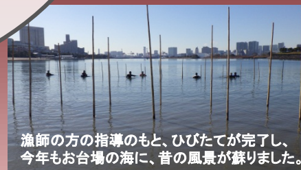
漁師の方の指導のもと、ひびたてが完了し、今年もお台場の海に、昔の風景が蘇りました。