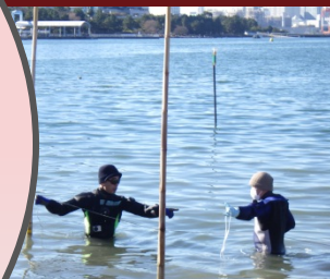
まっすぐ等間隔にひびを立てます。

ひびたて・種網張り作業後は、お台場海苔づくりの会やお台場学園の保護者の皆さんが、潮位の状況のみて、海苔網の高さを調節する作業及び観察を行っていきます。