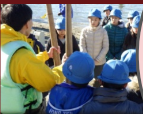
昔のひびたて道具の使用方法を学習しました。

12月17日(土)、港区立小中一貫教育校お台場学園(以下、お台場学園)5年生は、「総合的な学習の時間」の授業で、お台場海苔づくりのひび(※)たて・種網張り作業を見学するとともに、海苔の育成に関する環境等について理解を深めました。