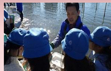
漁師の方から「海苔の種」を見せていただきました。