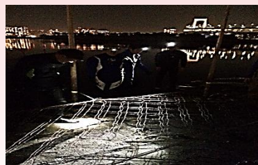
海苔網の高さ調節作業風景です。