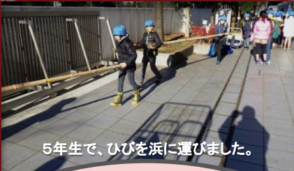
5年生で、ひびを浜に運びました。