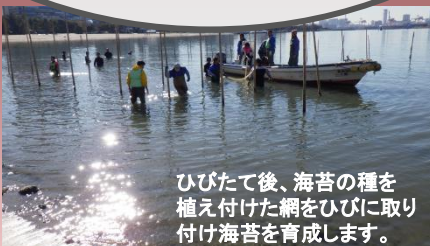
ひびたて後、海苔の種を植え付けた網をひびに取り付け海苔を育成します。