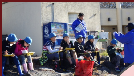
5年生は作業を見学しながら、熱心に学習カードにメモをとっていました