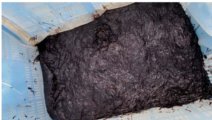
「刈り取られた海苔」

芝浦港南地区総合支所 台場分室 （お台場のりづくり かわら版 編集） ☎ 03-5500-2365