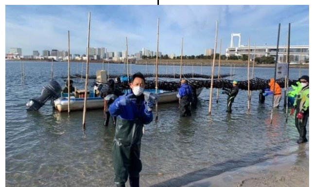
「オンライン授業の様子」