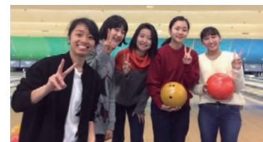
ボートレース大会(御成門)