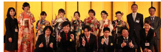
実行委員のみなさん