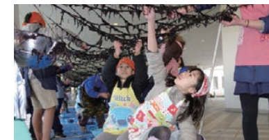
お台場海苔づくり(お台場)