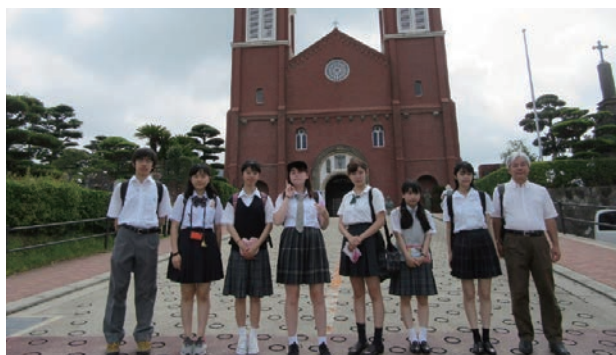
平和青年団のみなさん