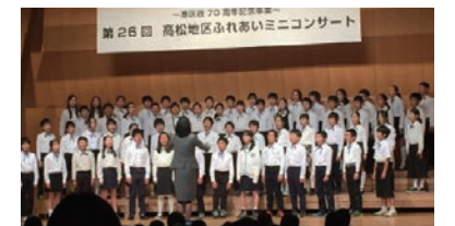
ふれあいミニコンサート(高松)