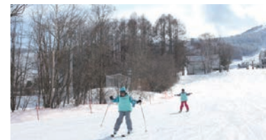
スキー教室(お台場)