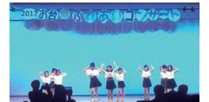
ふれあいコンサート(お台場)