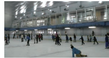
スケート教室(青山)