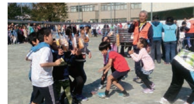
まぐるみ運動会(三田)