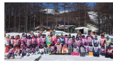
スキー教室(六本木)

2月・3月に行う地区があります。2泊3日でほとんどの子がすべることができるようになります。スケートは神宮で行います。