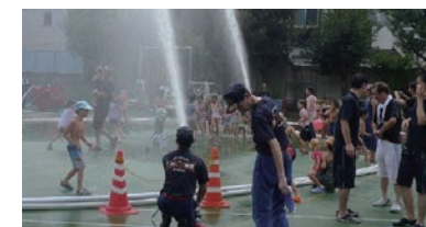
さようなら夏休み大会(高陵)

遊びを通じた防災訓練(体験)、海苔作り体験、おりがみヒコーキ教室など親子で一緒に楽しめます。