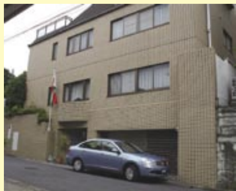
◀ベラルーシ大使館