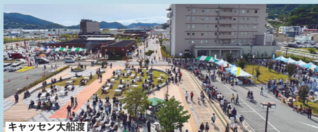
キヤッセン大船渡