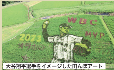
大谷翔平選手をイメージした田んぼアート