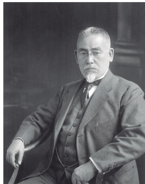
後藤新平（ごとうしんぺい）

後藤新平の故郷は岩手県奥州市です。同市から東へ沿岸部に出ると、東日本大震災で被害が大きかった大船渡市があります。今回は両市を訪問してみましょう。