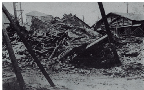
倒壊よりも火災による被害が大きいのが特徴で、港区でも芝で住宅の42%が焼失するなどしました。写真は現在の溜池周辺です