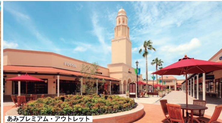
あみプレミアム・アウトレット