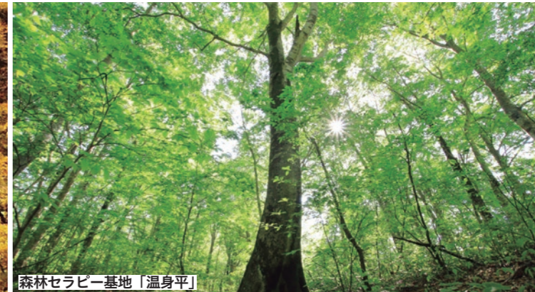
森林セラピー基地「温身平」