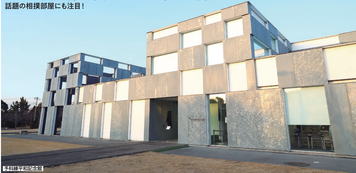
予科練平和記念館