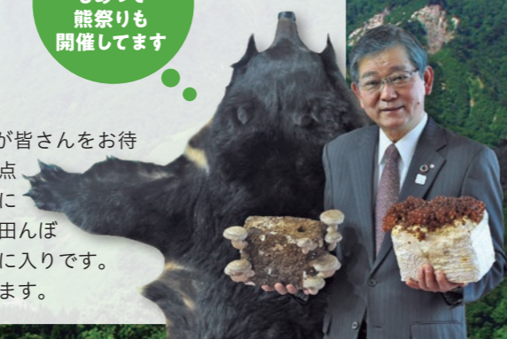
夏の樽口峠からの眺め

小国町は95%が山林となる山間の町で、“白い森”が皆さんをお待ちしています。また、最先端のセラミックの生産拠点があるのも小国町の自慢のひとつで、ルーツは戦前にさかのぼります。個人的には樽口峠からの絶景や、田んぼと山々の組み合わせといった、ふとした風景もお気に入りです。港区とはお互いに補い合える関係になれたらと思います。