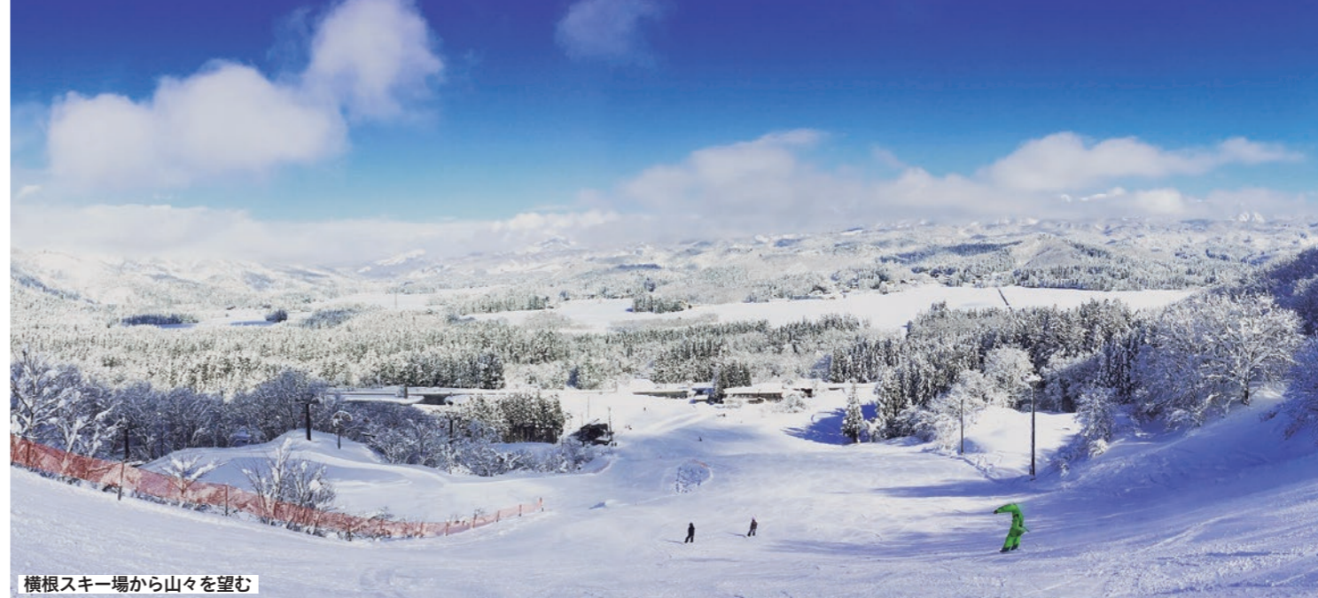
横根スキー場から山々を望む