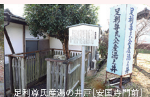
足利尊氏産湯の井戸 [安国寺門前]