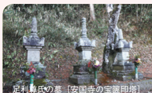
足利尊氏の墓 [安国寺の宝篋印塔]