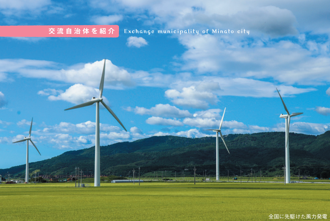
全国に先駆けた風力発電