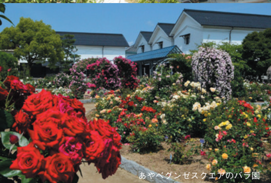
あやベグンゼスクエアのバラ園