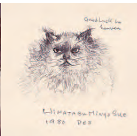
池部良氏による愛猫のイラスト