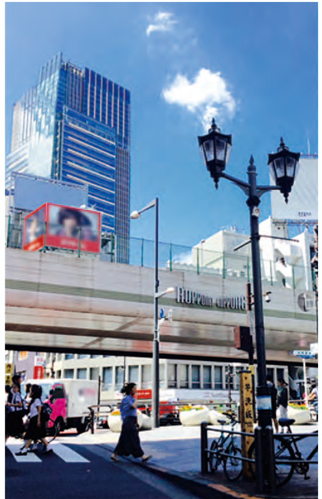
どこが一番、高い場所なのでしょう。