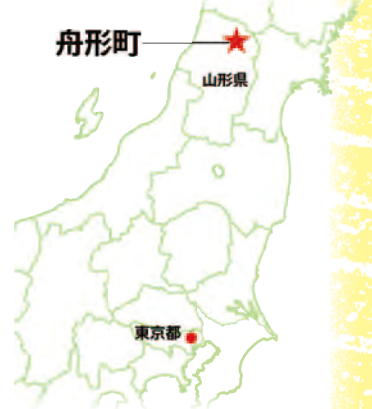
東京駅から舟形駅まで山形新幹線とJR山形線を使って新庄駅経由で約4時間前後