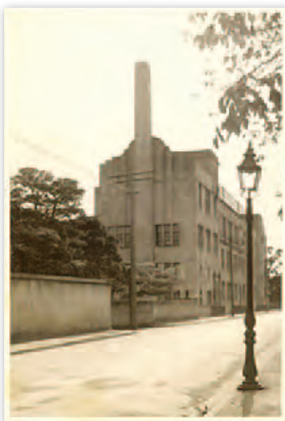
昭和8年に完成した東洋英和女学校の外観。いにしへの鳥居坂の美しい光景です。