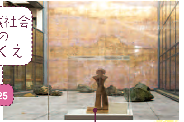
武蔵野図の前に展示