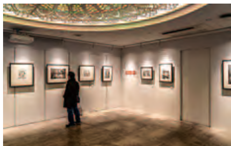
ハンガリー人アーティストによる作品が展示されている。