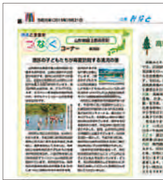
「広報みなと」令和元年(2019年)9月21日号で紹介されました