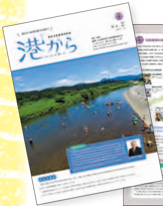
港区全国連携情報誌「港から」*2第2号1ページ