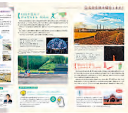
港区全国連携情報誌「港から」第2号3ページ