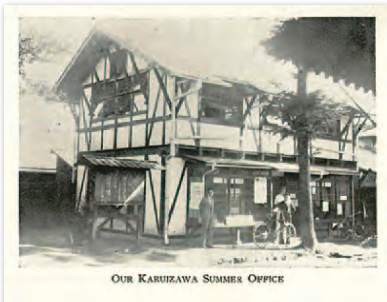
軽井沢の建築設計監督事務所は、旧軽井沢銀座通り、現在のミカド珈琲の場所にありました。

●取材協力 ..... 東洋英和女学院史料室 一粒社ヴォーリス建築事務所 (取材/高柳由紀子、田中亜紀 文/田中亜紀)