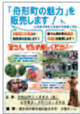
「山形県舟形町の魅力PRイベント」のチラシ:舟形中学校生徒の手作り