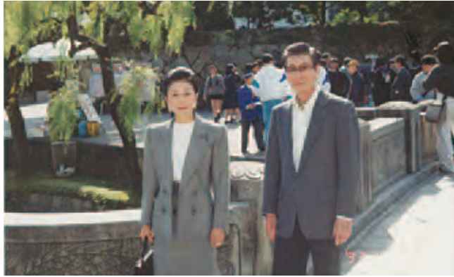
ご主人の講演先同行の際、倉敷にて

「私の子どもの頃？ イタズラばかり。屋根の上に登ったりね。お転婆だけど嘘をつかない子だって母は褒めてくれましたのよ。うちは大変広い日本家屋で、女中さんが何人もいて、拭き掃除だけで昼までかかったくらい。戦争中のこと？ もちろん覚えてますよ。軍隊の人たちが来て深くて立派な防空壕を掘ってくれました。祖父が食品の会社を経営していて、軍隊にも何かと協力的だったせいでしょうね。当時は空襲が怖いというより、飛行機が飛ぶのを見上げたことを覚えてます。主人の方は戦争で兵隊として南方の島に行かされて、輸送船が撃沈され泳いで24時間後に奇跡的に助けられた、ミミズを焼いて食べたこともあった、なんて話をしてくれました。私とは戦争の体験の質が全く違いますよね」