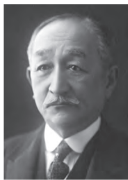
三井八郎右衛門高棟

昭和戦前期、三大財閥である三井・三菱・住友の総領家邸宅がすべて六本木エリアにあった。三菱4代目当主 岩崎小彌太郎は鳥居坂町の約4千坪の敷地に⑥、住友15代目当主 住友吉左衛門友純別邸は市兵衛町の約3千坪の敷地に②、いずれ劣らぬ豪邸を建てていたが、三井総領家10代目当主 三井八郎右衛門高棟男爵邸①の壮大さは別格であった。総領家の周辺には、一族の邸宅、賓客接待所、子弟の教育機関なども集まり、三井にとって麻布は縁の深い土地であった。ゆかりの場所を前後編にわけて紹介する。