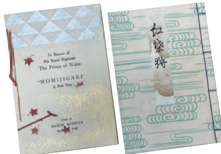
英国皇太子招待余興目録(英文/和文)