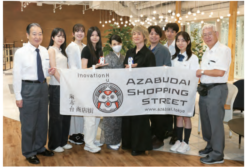
麻布台商店街メンバー

令和5(2023)年11月、主に神谷町駅から東京タワーまでのエリアの活性化を目指す「麻布台商店街」が誕生しました。地域住民・企業・高校生・大学生が一体となり、地域の魅力を発信する取り組みが進行中。今後の展望と、商店街が地域にどんな新風を吹き込むのか、関係者にお話を伺いました。