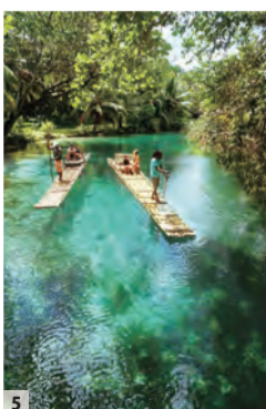
5 竹のいかだでのんびり川を下る「リバー・ラフティング」は観光客に人気のアクティビティ。