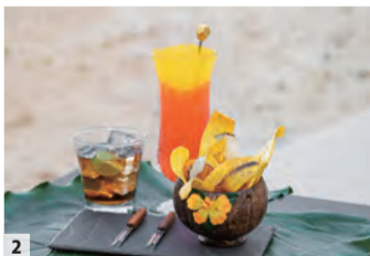
2 サトウキビが原料の名産品のラム酒を使ったカクテルも種類が豊富で人気。ただしアルコール度は40～50度とかなり高めなので、飲み過ぎにご用心。