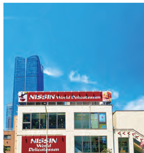
3 日進ワールドデリカテッセン