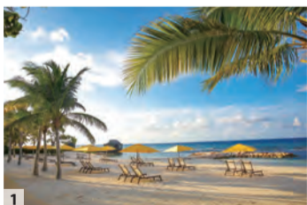
1 どこまでも続く青い海原。国内には世界トップクラスの美しさが誇るビーチがいくつもあ