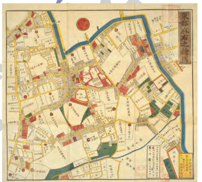
図1「江戸切絵図(麻布図)」現在の地図と比べて大分違いがあるのは当然ですが、今もその名残がある場所はたくさんあります。(流れに沿って)右下から左上に流れているのは「古川」です。今の地図と見比べてみてもそこまで大きく変わっていないことがわかります。この地図でどこが麻布十番(藩)が分かかりますか？

四、図1で示した「江戸切絵図(麻布図)」によれば、名前の上に家紋が入っているところは「大名家上屋敷」を示しているようです。数えてみると麻布図には17の家紋がありました。家紋そのものの図柄を通して日本の意匠を探るのは勿論、麻布に住まう大名はどの様な人物であったか？(家紋の名前も気になりますよね?)など興味は尽きません。この17の家紋が麻布にどう関わってくるのか、次号以降乞うご期待!