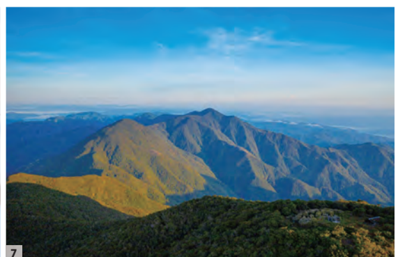
7 ジャマイカ初の世界遺産 ブルー・アンド・ジョン・クロウ・マウンテンズ(Blue and John Crow Mountains)国立公園。高級コーヒーとして日本にも愛好者の多いブルー・マウンテンの産地として知られるブルー・マウンテン山脈を含む国立公園。絶滅危惧種の鳥や西半球最大の蝶などの生息地でもある。