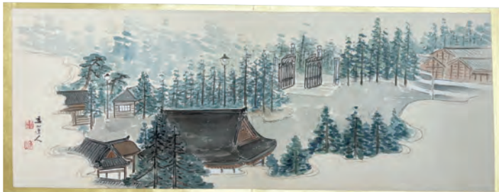
今井町邸内バラック(村上委山作)

華麗な饗宴の一方で、大正12(1923)年9月1日に関東大震災が起これると、三井はいち早く救済本部を結成。支援の一つとして今井町本邸と周辺の所有地約400坪を開放し、応急住宅(バラック)を建設して、被災者を受入れた。入居者145名から三井家に贈られた感謝状綴りに当時の風景画が4枚添えられている。下はその1枚で、画面手前中央に本邸玄関の屋根、奥に正門、その右手にバラックが描かれている。