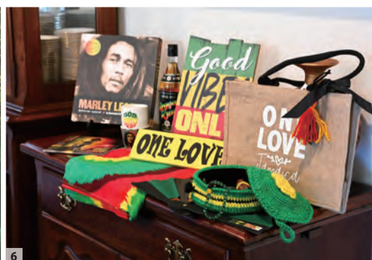
6 今回取材時に大使の背景にジャマイカを誇る伝説的アーティスト、ボブ・マーリー(Bob Marley)(1945～1981)を記念した飾りつけが見えた。2024年、伝記映画「ボブ・マーリー・ONE LOVE」が大ヒットしたボブ・マーリーはレゲエの神様と呼ばれ、彼の名曲「ONE LOVE(ワンラブ)」は多様な民族が共存するジャマイカの精神を表す言葉となっている。