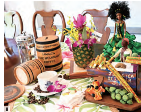
8 大使によるコーディネート。自らがアレンジして下さり、ブルー・マウンテン・コーヒーやアキという果物などジャマイカの名産品やTHE AZABUのカードがバイナッブルの横に添えられて、大使のおもてなしの心が伝わってくる。

一方、ジャマイカ料理のお勧めを伺うと「たくさんのスパイスが入ったジャークチキンと、世界ではジャマイカ人だけが食べるアキ。アキはフルーツですがウサイン・ボルト(Usain St. Leo Bolt)(1986～)選手は2009年、男子100mで9秒58の前人未到の世界新記録を樹立。2024年9月現在も、記録は破られていない。