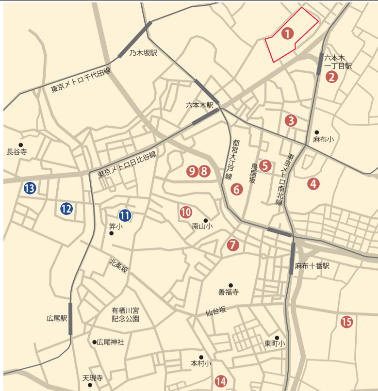
三井ゆかりの場所を現在の地図上に図示(青字は後編で紹介)