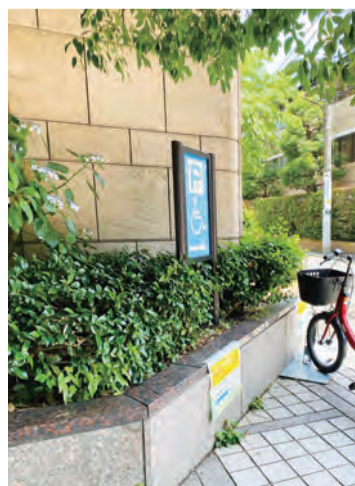
2 サイクルポート(麻布地区総合支所)