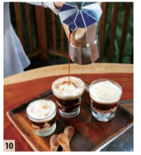
10 ジャマイカブルー・マウンテン・コーヒー

ジャマイカでは鰯と一緒に調理するメニューがあります。また、米と豆をココナツミルクで長時間かけて炊き上げるライス&ピースという日本の赤飯のようなものも。どれも大使の得意料理。