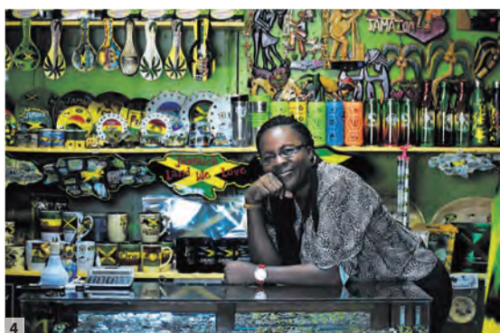
4 首都キングストンには100以上の店が出店するジャマイカ最大のクラフトマーケットがある。こちらも所狭しとお土産が並ぶ。