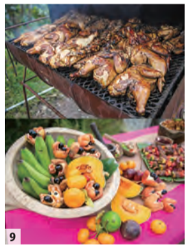
9 ジャマイカ料理。上はジャマイカのソウルフード、ジャークチキン。大使の得意料理でもある。下はアキとフルーツの数々。ジャマイカの自然の豊かさが感じられる。