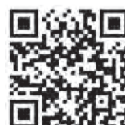
麻布地区総合支所 協働推進課 X

訓練内容 校庭や体育館での訓練があります。詳細は麻布地区総合支所協働推進課のX(旧Twitter)をご確認ください。