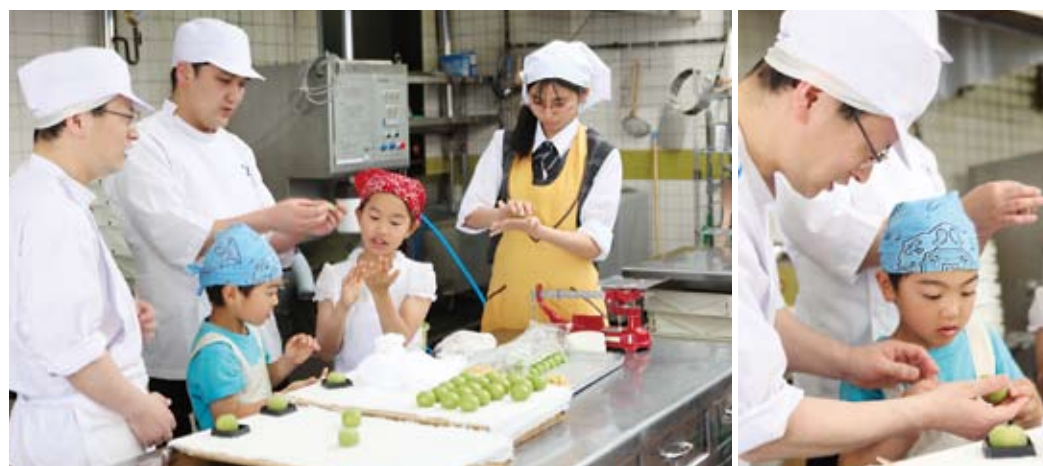
デリケートな仕上げ作業に挑戦。とても親切にご指導いただきました。