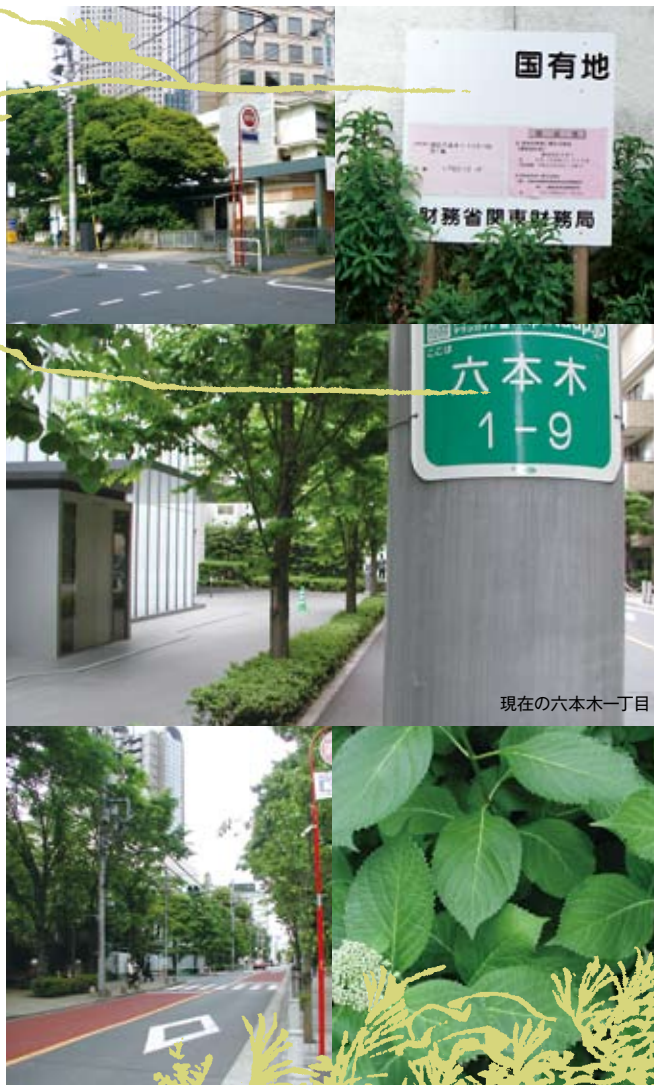
現在の六本木一丁目

明治39年(1906)に久邇宮家から東久邇宮家を創立された東久邇宮稔彦親王は、大正3年(1914)、麻布の御用邸に住まわれた。翌年、明治天皇の第9皇女泰宮聡子内親王とご結婚された。陸軍大学校を卒業、大正9年(1920)フ