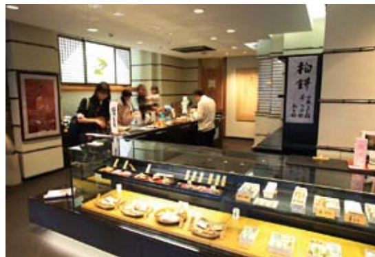
(取材/石山恒子、石山 茜、鈴木大智、大村公美子、大村 響文/大村公美子)

柔和に語るお人柄ながら、最後にはお仕事の厳しさをしっかり教えて下さった青野さん。「ココで働きたい!」、茜ちゃんの内なる情熱に火が付いた瞬間でした。